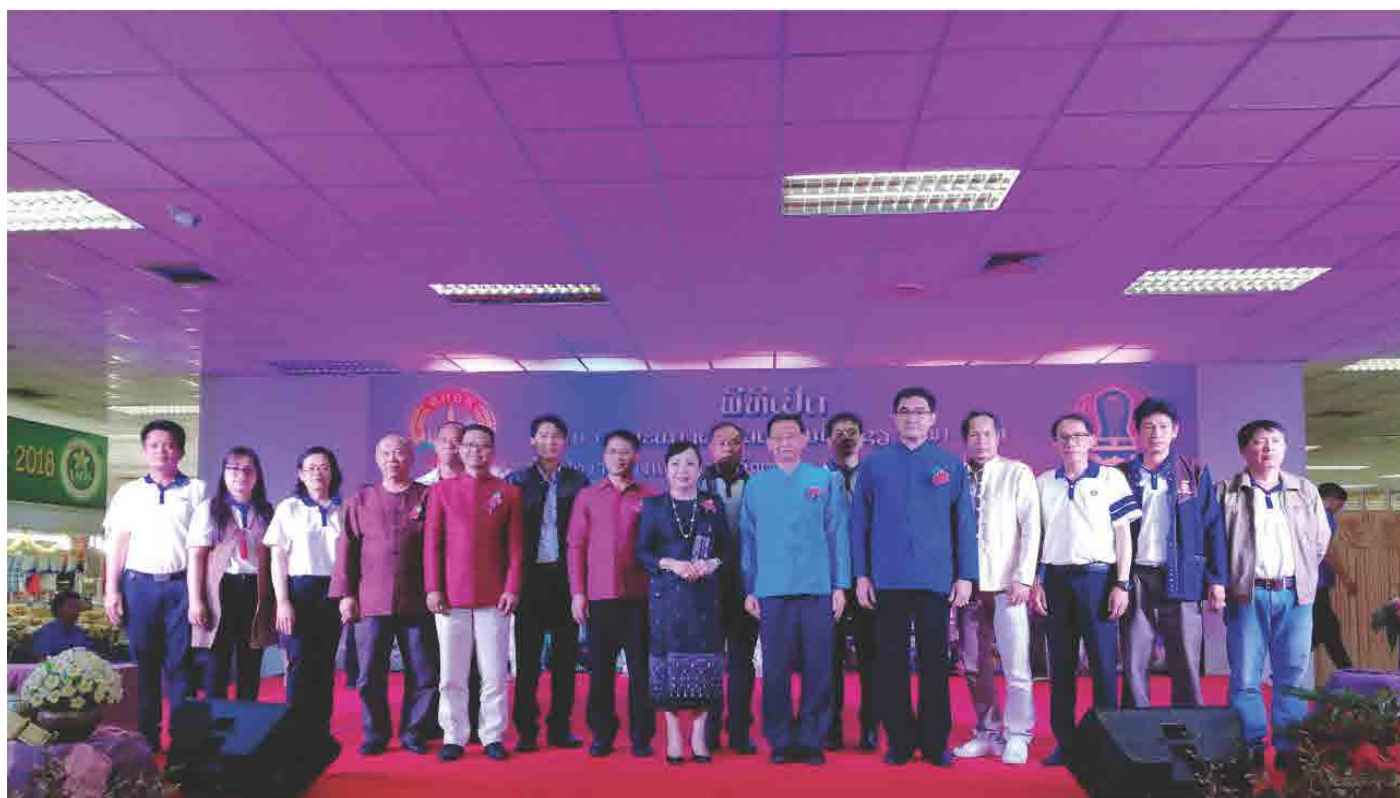
ພິທີເປີດງານວາງສະແດງ ຜະລິດຕະພັນໄທ ຊຽງໃໝ່-ລາວ ວັນທີ 21 ກຸມພາ 2018 ທີ່ ສູນການຄ້າລາວ-ໄອເຕັກ