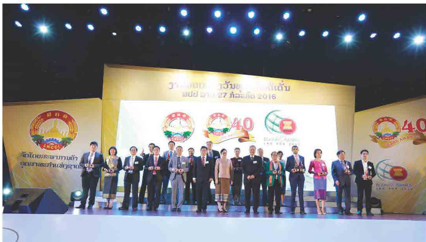
ງານມອບລາງວັນທຸລະກິດດີເດັ່ນ ສປປ ລາວ ວັນທີ 27 ກໍລະກົດ 2016