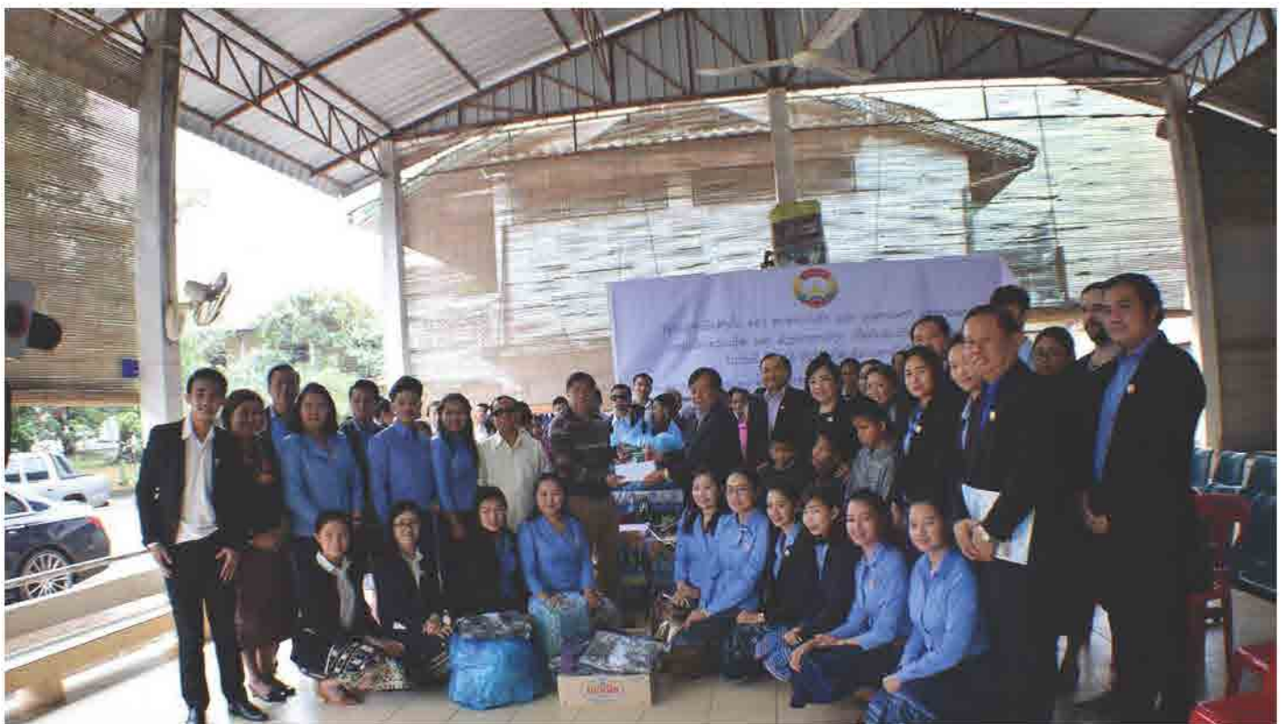
ສະພາການຄ້າ ແລະ ອຸດສາຫະກຳ ແຫ່ງຊາດລາວ ມອບເຄື່ອງຊ່ວຍເຫຼືອ ເດັກນ້ອຍພິການທາງສາຍຕາ ປີ 2017 ວັນທີ 27 ທັນວາ 2017 ທີ່ ສູນພິການຕາທົ່ງປົງ