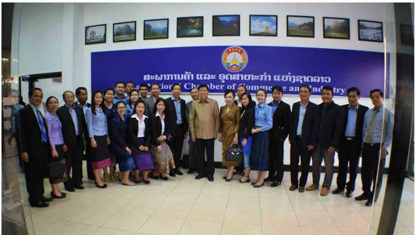
ທ່ານ ທອງລຸນ ສີສຸລິດ ນາຍົກລັດຖະມົນຕີ ແຫ່ງ ສປປ ລາວ ຢ້ຽມຢາມ ສະພາການຄ້າ ແລະ ອຸດສາຫະກຳ ແຫ່ງຊາດລາວ ໃນວັນທີ 27 ຕຸລາ 2017