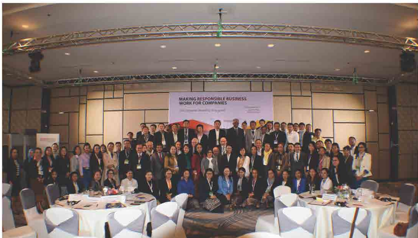
ກອງປະຊຸມສຳມະນາ Making Responsible Business Work for Companies (CSR) ວັນທີ 19 ທັນວາ 201 ທີ່ ນະຄອນຫຼວງວຽງຈັນ.