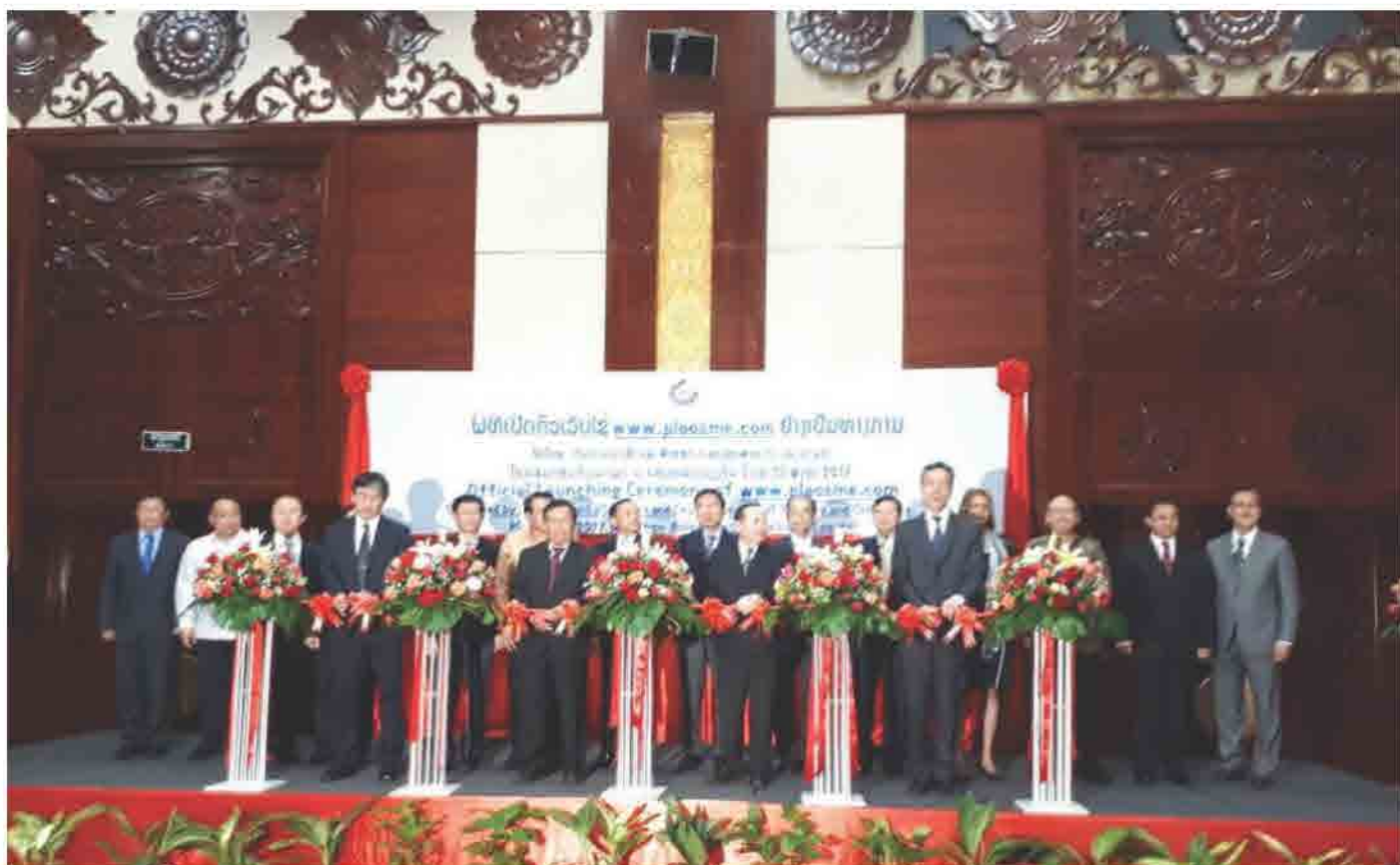
ພິທີເປີດນຳໃຊ້ເວັບໄຊຕົວເວັບໄຊ www.plaosme.com ຢ່າງເປັນທາງການ ໃນວັນທີ 30 ສິງຫາ 2017 ທີ່ ໂຮງແຮມດອນຈິນພາເລສ