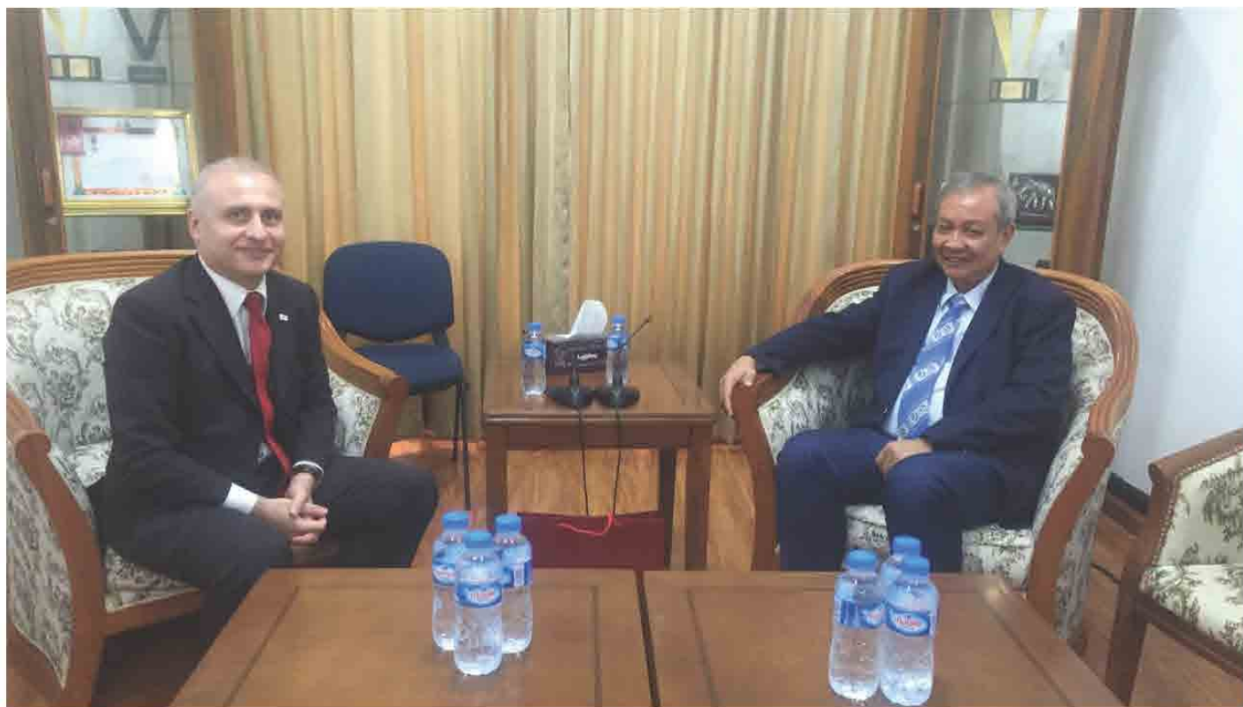
ປະທານ ສຄອຊ ຕ້ອນຮັບ ເອກອັກຄະລັດຖະທູດ ຈີເຈຍ ປີ 2018