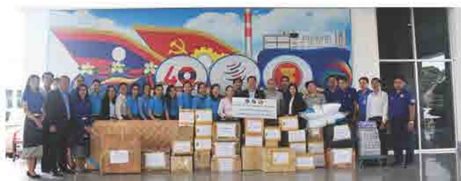
ສະພາການຄ້າ ແລະ ອຸດສາຫະກຳ ແຫ່ງຊາດລາວ ມອບ ເງິນ, ເຄື່ອງມຸງຮົ່ມ ແລະ ເຄື່ອງໃຊ້ທີ່ຈຳເປັນ ຊ່ວຍເຫຼືອ ຜູ້ປະສົບໄພນ້ຳຖ້ວມ ຢູ່ເມືອງສະໜາມໄຊ ແຂວງອັດຕະປື