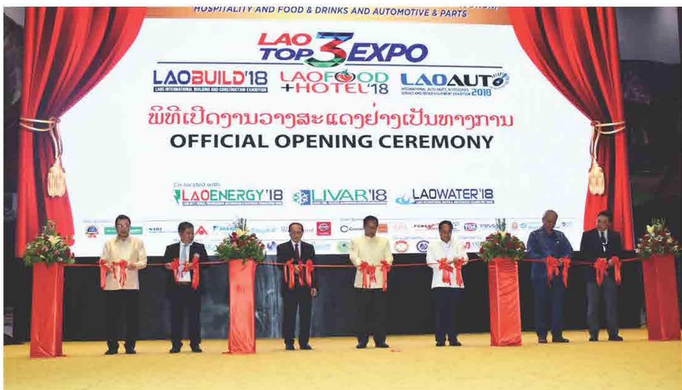
ພິທີເປີດງານວາງສະແດງ LAO TOP 3 EXPO ວັນທີ 07 ມິຖຸນາ 2018 ທີ່ ຫໍປະຊຸມແຫ່ງຊາດ