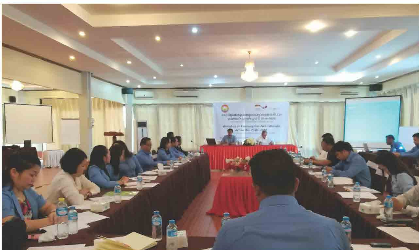
ກອງປະຊຸມ ປຶກສາຫາລືເພື່ອສ້າງແຜນຍຸດທະສາດ ການພັດທະນາ ພາກທຸລະກິດລາວ 2018-2020 ວັນທີ 11 ສິງຫາ 2017 ທີ່ ເມືອງ ວັງວຽງ ແຂວງ ວຽງຈັນ