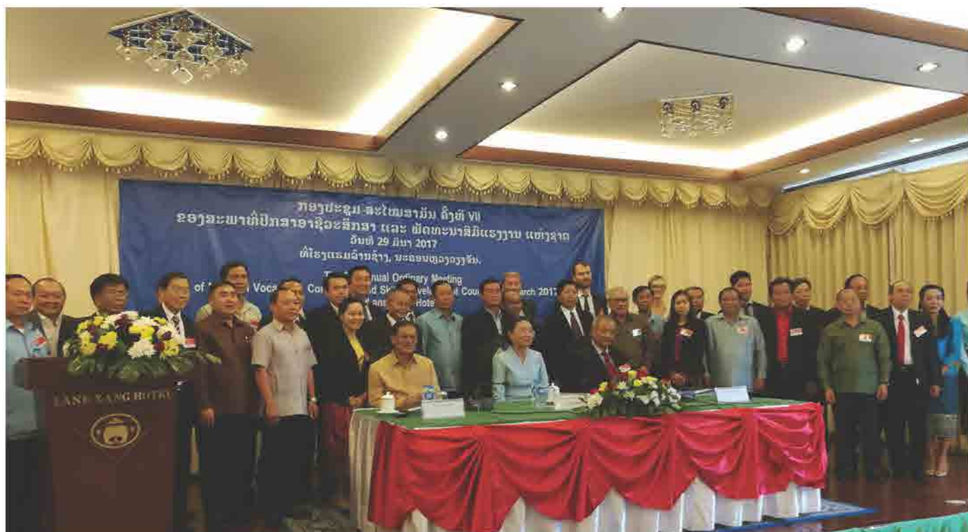
ກອງປະຊຸມສະໄໝສາມັນ ຄັ້ງທີ VII ຂອງສະພາທີ່ປຶກສາອາຊີວະສຶກສາ ແລະ ພັດທະນາສີມືແຮງງານ ແຫ່ງຊາດ ວັນທີ 29 ມີນາ 2017 ທີ່ ໂຮງແຮມ ລ້ານຊ້າງ, ນະຄອນຫຼວງວຽງຈັນ