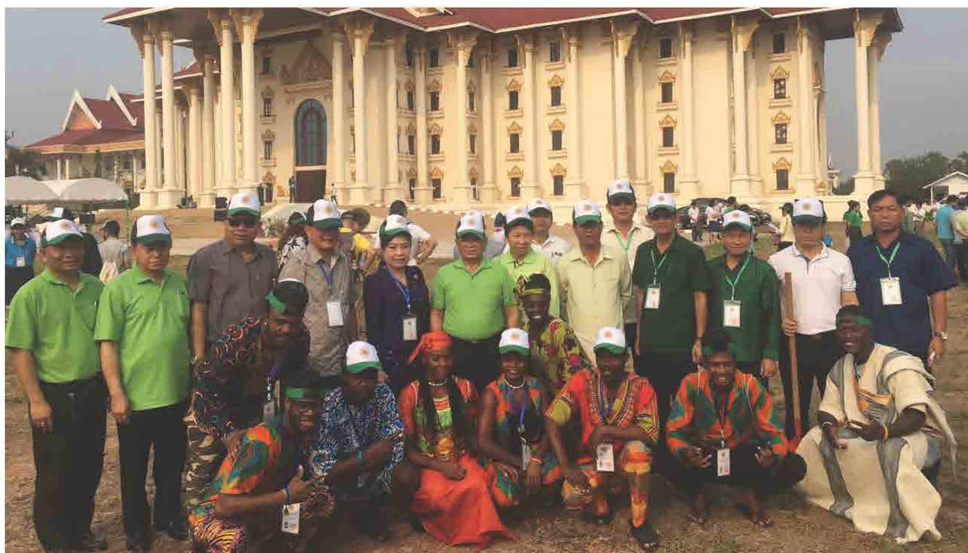
ກິດຈະກຳປູກຕົ້ນໄມ້ ເພື່ອສະເຫຼີມສະຫຼອງວັນໄມ້ໂລກ, ທີ່ ນະຄອນຫຼວງວຽງຈັນ ສປປ ລາວ ຈັດຂຶ້ນໂດຍ ອົງການໄມ້ໂລກ ໃນວັນທີ 29-30 ມີນາ 2018