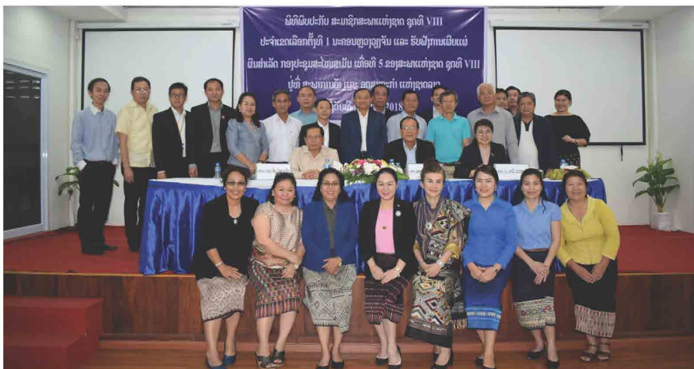
ພິທີພົບປະກັບ ສະມາຊິກສະພາແຫ່ງຊາດ ຊຸດທີ VIII ປະຈຳເຂດເລືອກຕັ້ງທີ 1 ນະຄອນຫຼວງວຽງຈັນ ແລະ ຮັບຟັງການເຜີຍແຜ່ຜົນສຳເລັດ ກອງປະຊຸມສະໄໝສາມັນ ເທື່ອທີ 5 ຂອງສະພາແຫ່ງຊາດ ຊຸດທີ VIII ທີ່ ສະພາການຄ້າ ແລະ ອຸດສາຫະກຳ ແຫ່ງຊາດລາວ ໃນວັນທີ 03 ສິງຫາ 2018