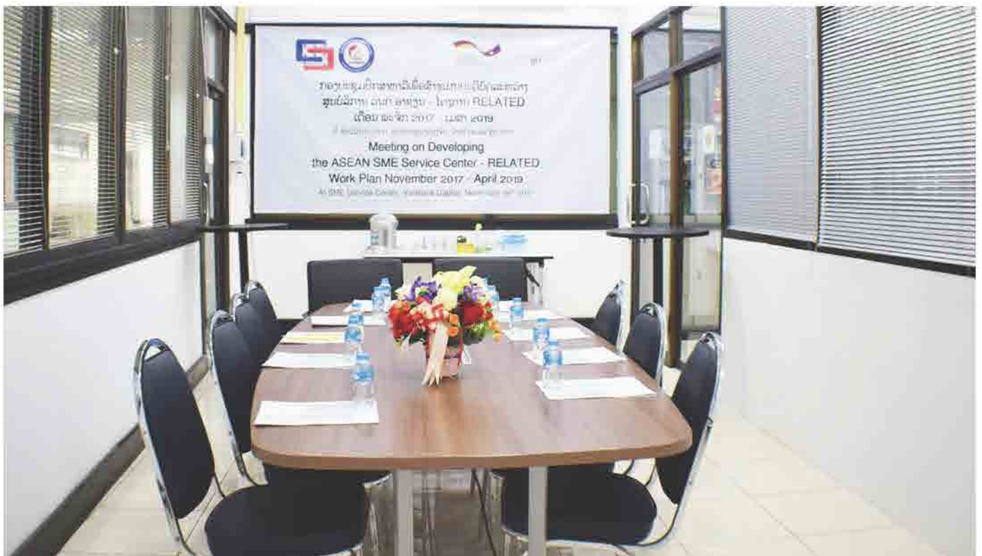
ຫ້ອງກອງປະຊຸມນ້ອຍ ຂອງ ສຄອ ແຫ່ງຊາດລາວ