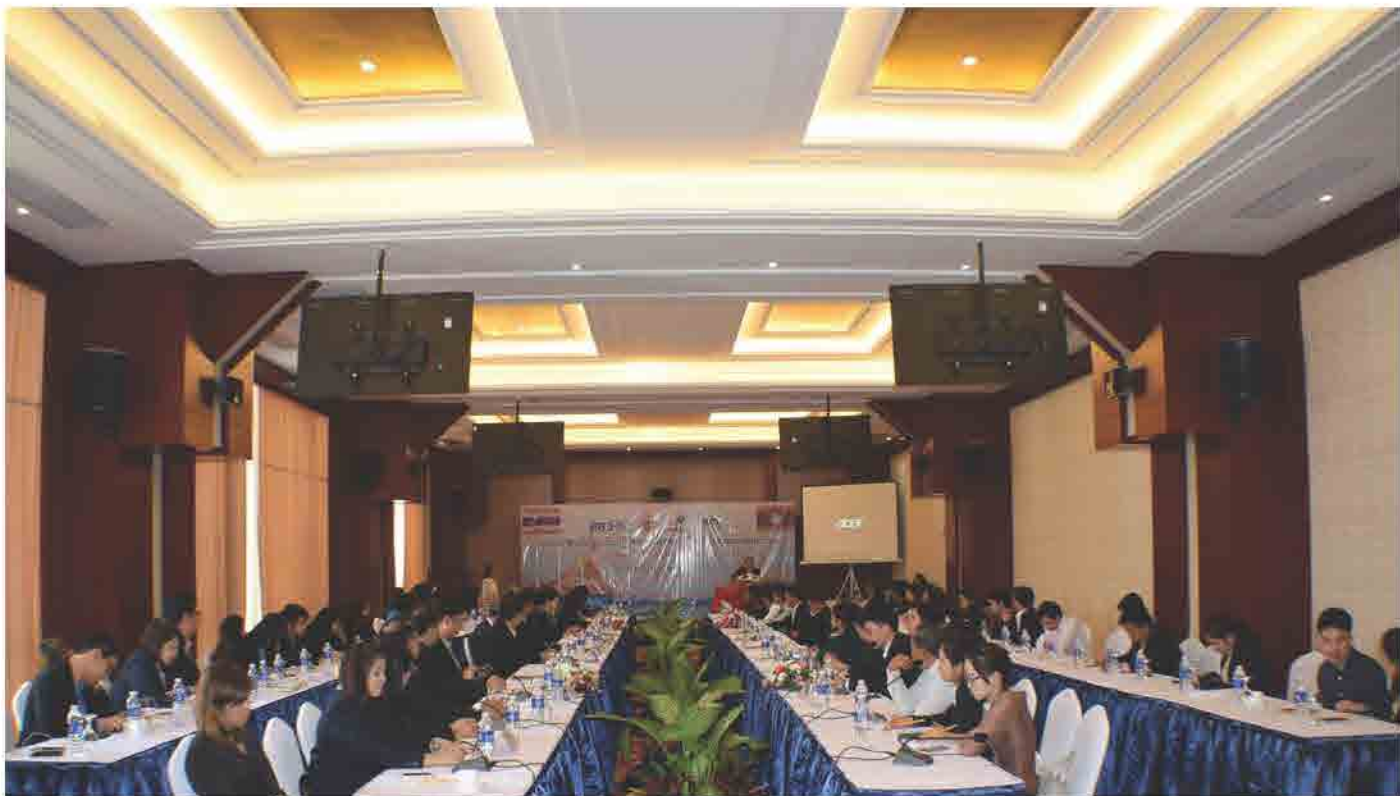
ກອງປະຊຸມສຳມະນາ ການແລກປ່ຽນຖອດຖອນບົດຮຽນ ການສົ່ງເສີມ ແລະ ພັດທະນາຜູ້ກອບການໃໝ່ ລະຫວ່າງ ລາວ-ໄທ ວັນທີ 13 ທັນວາ 2017 ທີ່ ໂຮງແຮມແລນມາກ,