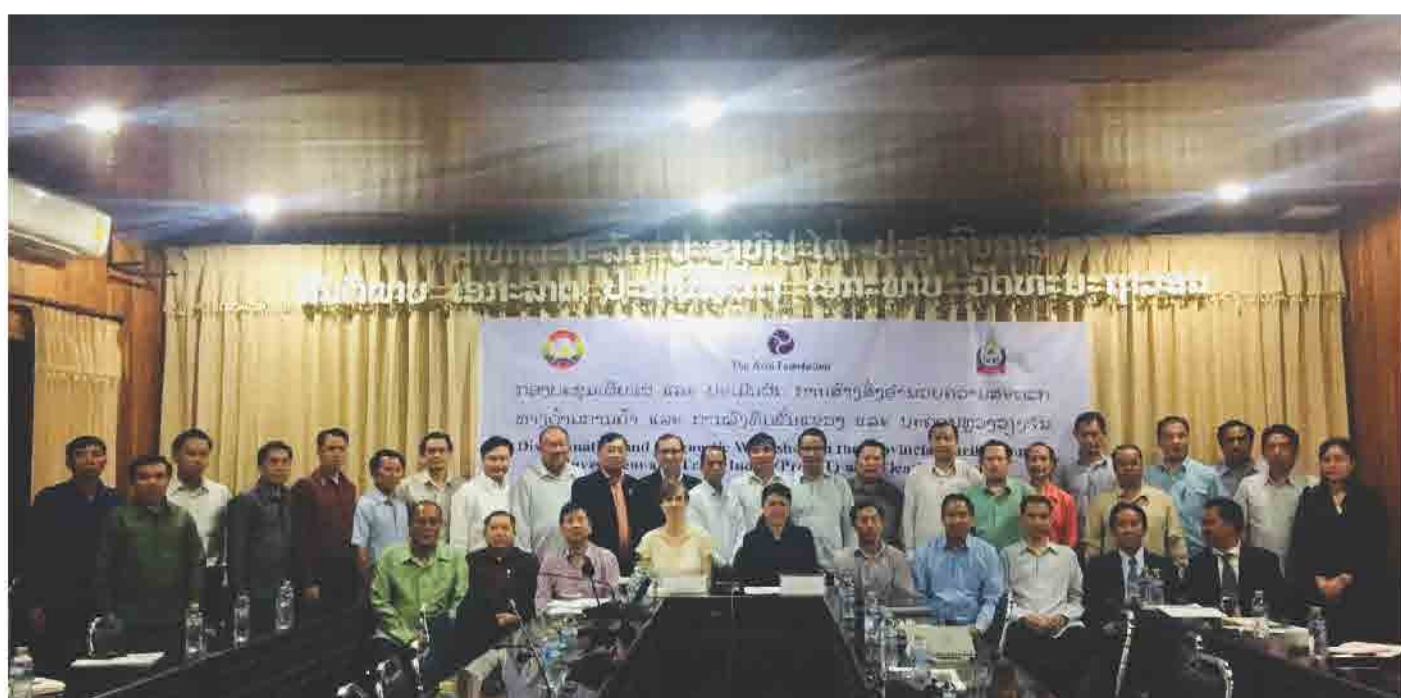
ກອງປະຊຸມເຜີຍແຜ່ ແລະ ປະເມີນຜົນການສ້າງສິ່ງອຳນວຍຄວາມສະດວກທາງດ້ານການຄ້າ ແລະ ການລົງທຶນ ຂັ້ນແຂວງ ແລະ ນະຄອນຫຼວງ ທີ່ ແຂວງ ຫຼວງພະບາງ ປີ 2018