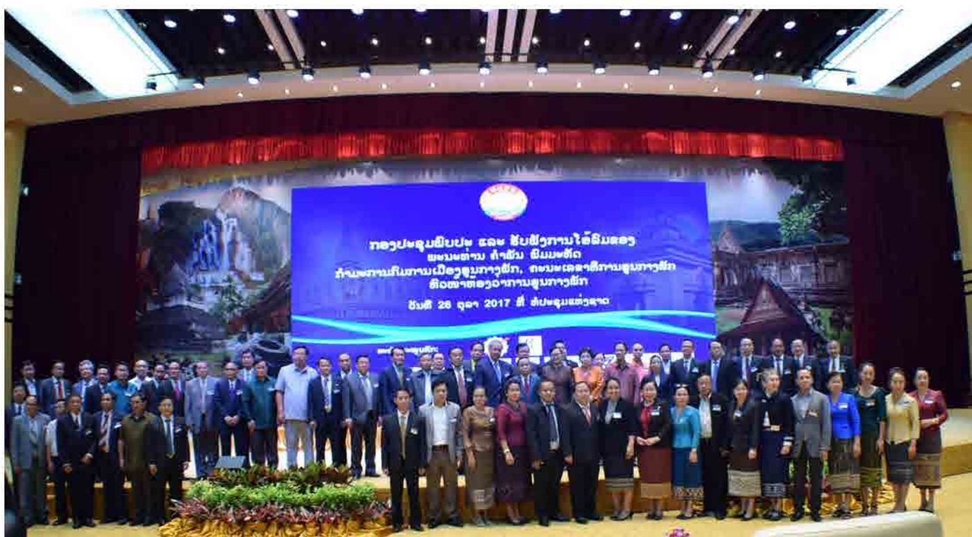
ກອງປະຊຸມພົບປະ ແລະ ຮັບຟັງການໂອ້ລົມຂອງ ທ່ານ ຄຳພັນ ພິມມະທັດ, ຫົວໜ້າຫ້ອງການສູນກາງພັກ ວັນທີ 26 ຕຸລາ 2017 ທີ່ ຫໍປະຊຸມແຫ່ງຊາດ