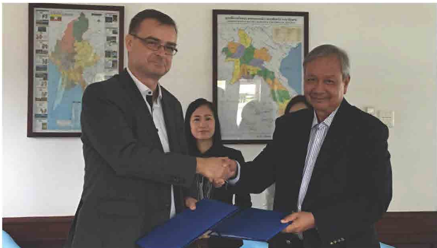
ສະຖານທູດລູກຊຳບວກປະຈຳລາວ ໄດ້ລົງນາມໃນສັນຍາຮ່ວມກັບສະພາການຄ້າ ແລະ ອຸດສາຫະກຳແຫ່ງຊາດລາວ ເພື່ອໃຫ້ການຊ່ວຍເຫຼືອໃນວຽກງານອອກໃບຢັ້ງຢືນໃຫ້ກັບຜູ້ຜະລິດຊາ ລາວ