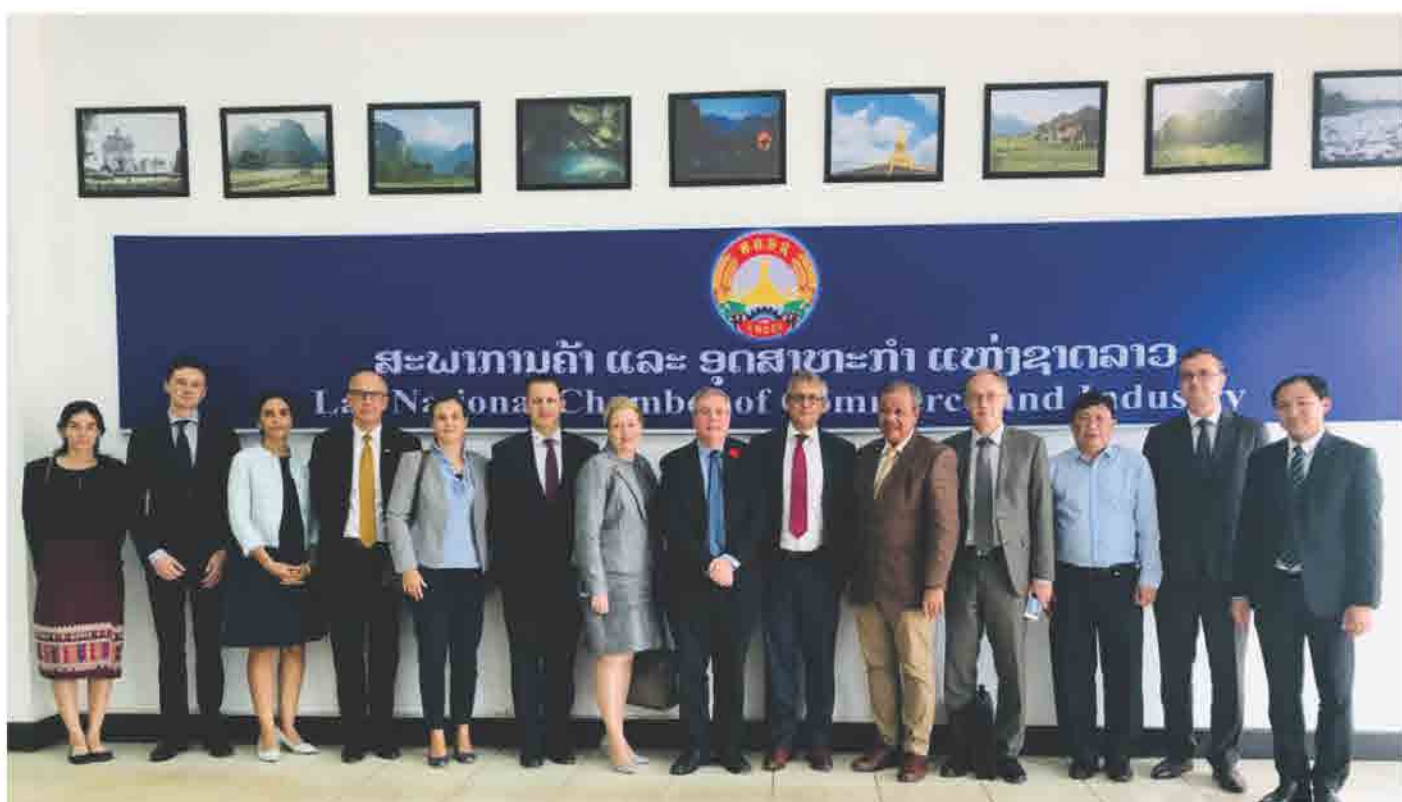
ປະທານ ສຄອຊ ຕ້ອນຮັບຄະນະເອກອັກຄະລັດຖະທູດ ບັນດາປະເທດ ທີ່ບໍ່ມີສະຖານທູດຕັ້ງຢູ່ ສປປ ລາວ