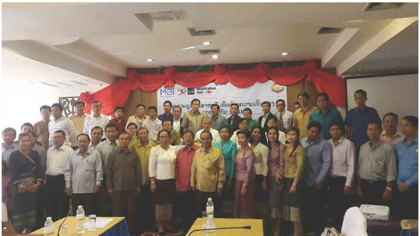
ກອງປະຊຸມ ປຶກສາຫາລື ສ້າງຄວາມເຂັ້ມແຂງ ໃຫ້ພາກທຸລະກິດຂັ້ນແຂວງ ທີ່ ແຂວງ ຈຳປາສັກ ປີ 2017