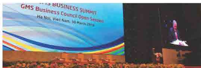
ກອງປະຊຸມ “GMS Business Summit” ວັນທີ 30 ມີນາ 2018 ທີ່ ຮ່າໂນຍ, ປະເທດ ຫວຽດນາມ