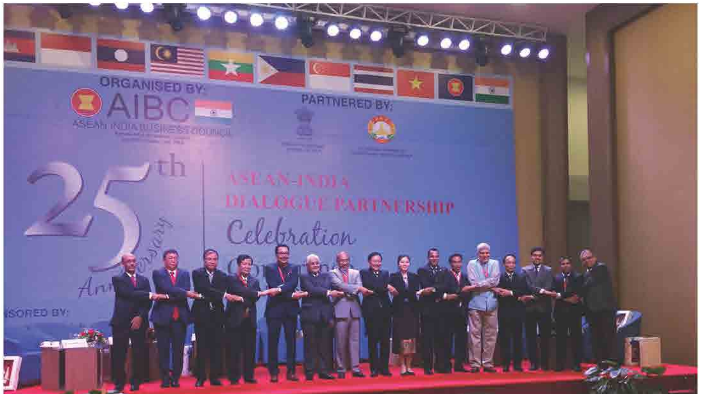
ກອງປະຊຸມ ASEAN-India 25th Anniversary Dialogue Partnership ວັນທີ 07 ສິງຫາ 2017 ທີ່ ນະຄອນຫຼວງວຽງຈັນ