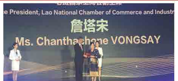
ງານວາງສະແດງ CAEXPO 2018 ຢູ່ ນະຄອນນາມິງ, ແຂວງ ກວາງຊີ, ປະເທດຈີນ