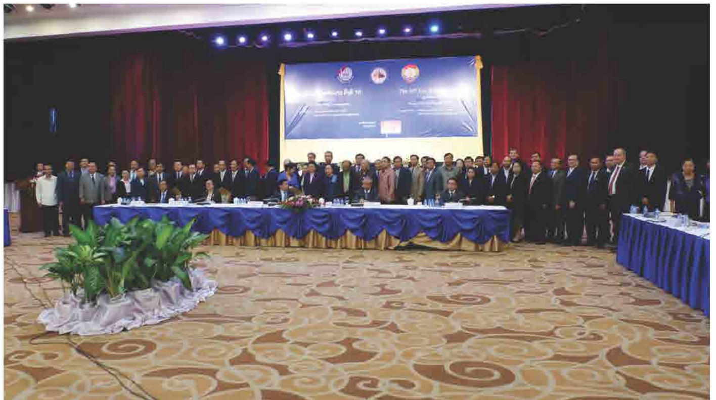
ກອງປະຊຸມທຸລະກິດລາວ ຄັ້ງທີ 10 ວັນທີ 28 ມີນາ 2017 ທີ່ ໂຮງແຮມ ດອນຈັນພາເລສ, ນະຄອນຫຼວງວຽງຈັນ