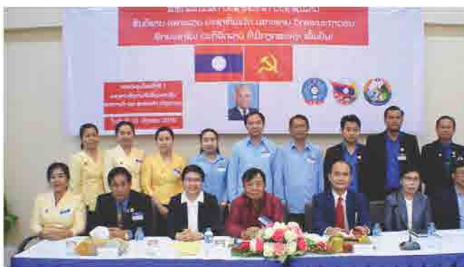
ກອງປະຊຸມໃຫຍ່ຄັ້ງ I ຂອງອົງການຈັດຕັ້ງມະຫາຊົນ ສຄອຊ ວັນທີ 19 ມັງກອນ 2018 ທີ່ ສຄອຊ