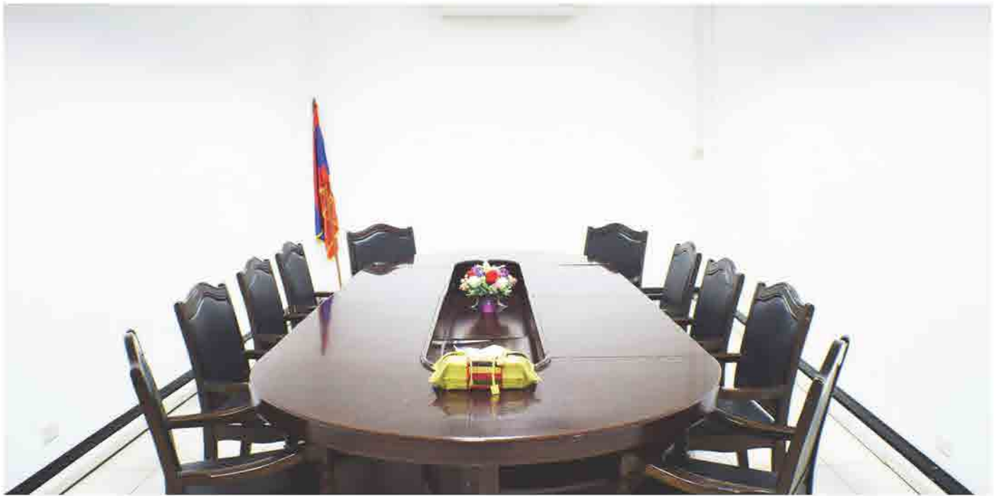
ຫ້ອງກອງປະຊຸມ ນ້ອຍ ຂອງ ສຄອ ແຫ່ງຊາດລາວ