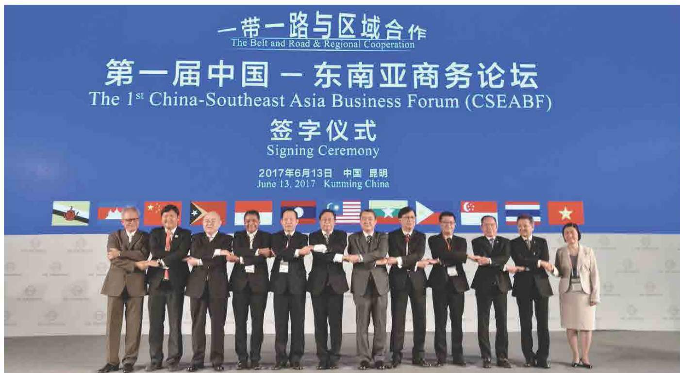
ກອງປະຊຸມ “The 1st China-Southeast Asia Business Forum(CSEABF)” ໃນວັນທີ 13 ມິຖຸນາ 2017 ທີ່ ຄຸນມິງ, ປະເທດ ຈີນ