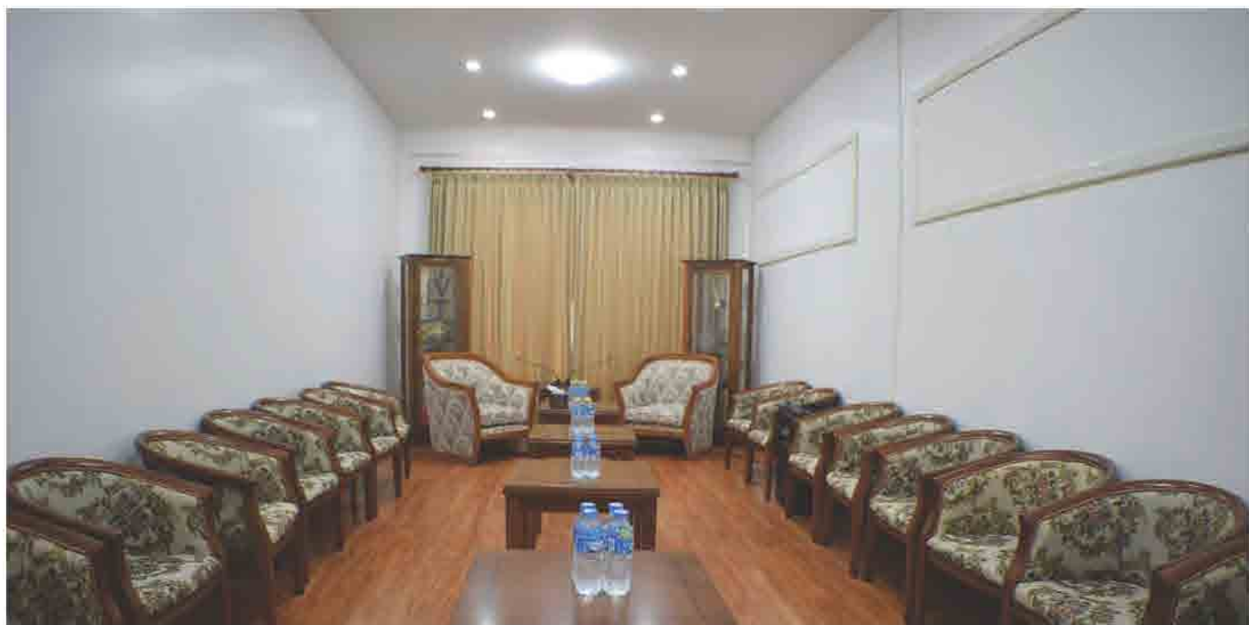
ຫ້ອງຮັບແຂກ VIP ຂອງ ສຄອ ແຫ່ງຊາດລາວ