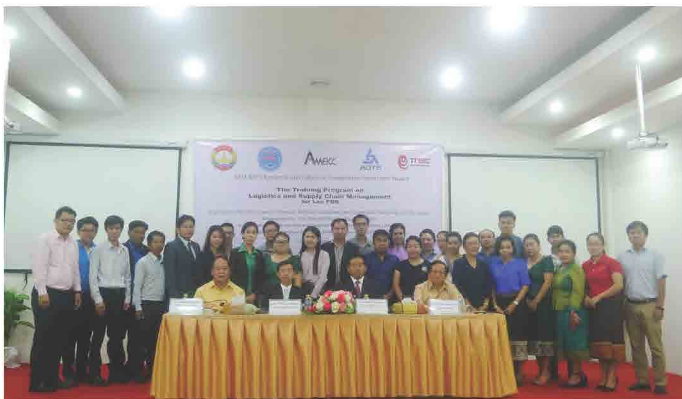
ສຳມະນາ ການຄຸ້ມຄອງຕ່ອງໂສ້ການສະໜອງ ແລະ ໂລຈິດສຕິກ ທີ່ ສະພາການຄ້າ ແລະ ອຸດສາຫະກຳ ແຫ່ງຊາດລາວ