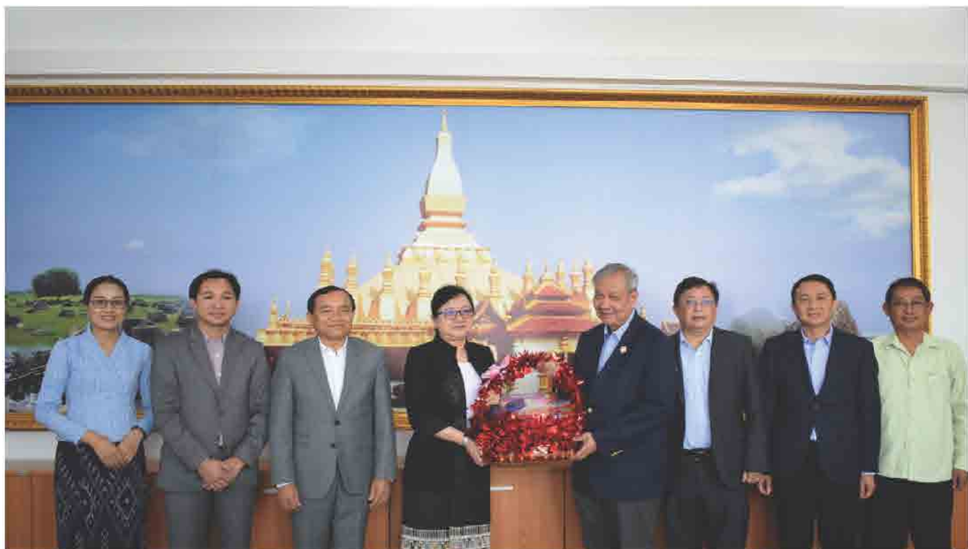
ອວຍພອນປີໃໝ່ 2019 ການນຳ ກະຊວງ ອຸດສາຫະກຳ ແລະ ການຄ້າ