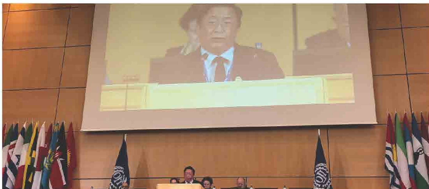
ກອງປະຊຸມປະຈຳປີ ຂອງອົງການແຮງງານສາກົນ ປະຈຳປີ 2017 ແລະ 2018 ທີ່ ເຈນນີວາ ປະເທດ ສະວິດເຊີແລນ