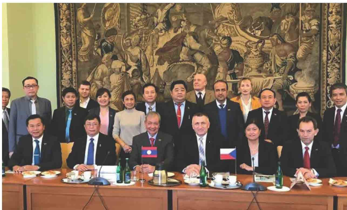
ກອງປະຊຸມພົບປະທຸລະກິດ ສປປ ລາວ ແລະ ສາທາລະນະລັດ ເຊັກ ວັນທີ 19 ຕຸລາ 2018 ທີ່ ສາທາລະນະລັດເຊັກ