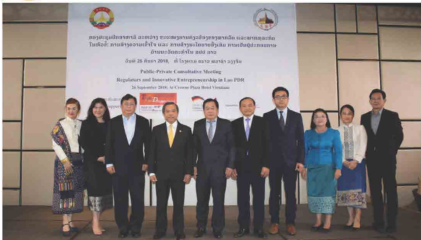
ກອງປະຊຸມປຶກສາຫາລື ລະຫວ່າງ ຂະແໜງການກ່ຽວຂ້ອງ ຂອງພາກລັດ ແລະ ພາກທຸລະກິດ ໃນຫົວຂໍ້: ການສ້າງຄວາມເຂົ້າໃຈ ແລະ ນະໂຍບາຍສົ່ງເສີມການເປັນຜູ້ປະກອບການ ດ້ານນະວັດຕະກຳ ໃນ ສປປ ລາວ ວັນທີ 26 ກັນຍາ 2018 ທີ່ ນະຄອນຫຼວງວຽງຈັນ