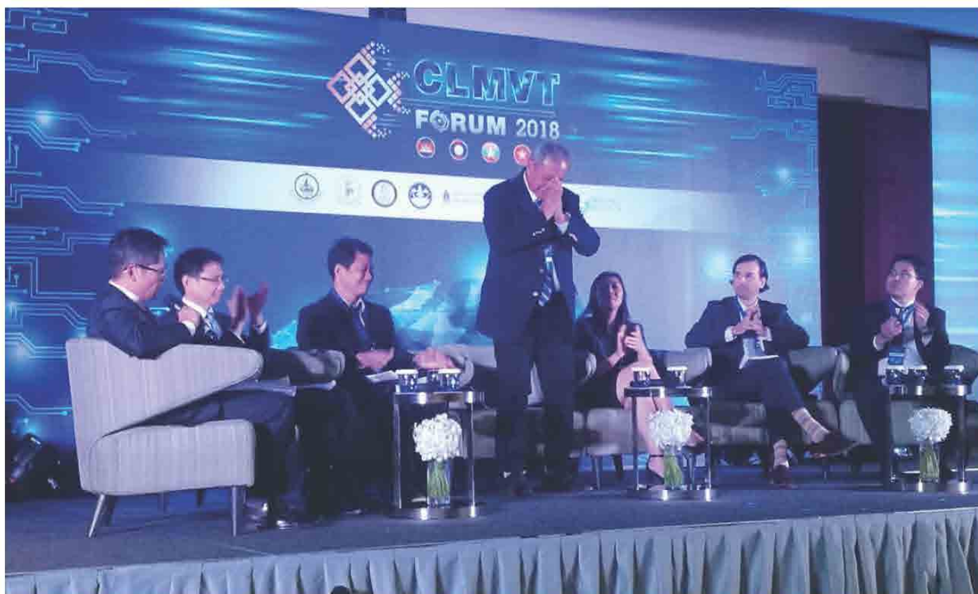
ໂຄງການ CLMVT Forum 2018 CLMVT Taking-Off through Technology ໄດ້ຈັດຂຶ້ນລະຫວ່າງ ວັນທີ 16-17 ສິງຫາ 2018 ທີ່ ໂຮງແຮມ ເຊັນທາລາແກຣນ ແລະ ບາງກອກຄອນເວັນຊັນເຊັນເຕີ ເຊັນທັນເວີນ ບາງກອກ ປະເທດ ໄທ