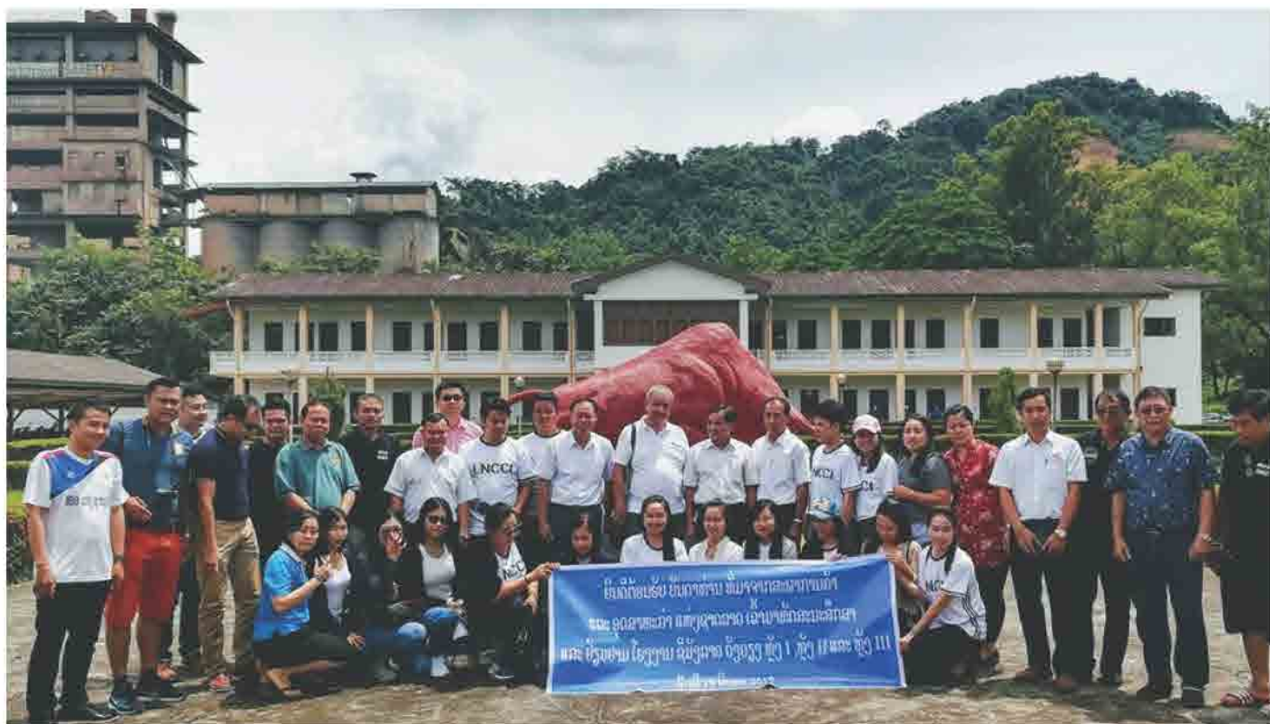
ຄະນະ ສະພາການຄ້າ ແລະ ອຸດສາຫະກຳ ແຫ່ງຊາດລາວ ລົງຢ້ຽມຢາມໂຮງງານສີມັງວັງວຽງ ຫຼັງ I,II,III ປີ 2017