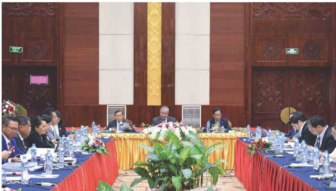
ກອງປະຊຸມ ຄະນະບໍລິຫານງານ ສຄອຊ ຄັ້ງວັນທີ 05 ກໍລະກົດ 2018 ທີ່ ໂຮງແຮມ ດອນຈັນພາເລສ