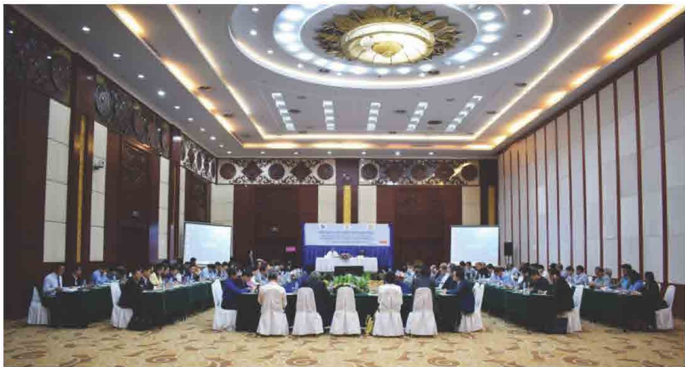
ກອງປະຊຸມຄະນະກຳມະການຊີ້ນຳກອງປະຊຸມທຸລະກິດລາວ ໃນວັນທີ 05 ເມສາ 2018 ທີ່ ໂຮງແຮມ ດອນຈັນພາເລສ, ນະຄອນຫຼວງວຽງຈັນ