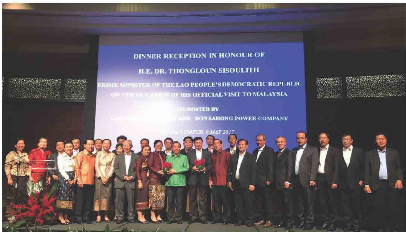
ຄະນະນັກທຸລະກິດ ຕິດຕາມ ຄະນະຜູ້ແທນລາວນຳໂດຍ ທ່ານ ນາຍົກລັດຖະມົນຕີ ແຫ່ງ ສປປ ລາວ ຢ້ຽມຢາມ ປະເທດ ມາເລເຊຍ ໃນລະຫວ່າງ ວັນທີ 09-10 ພຶດສະພາ 2017