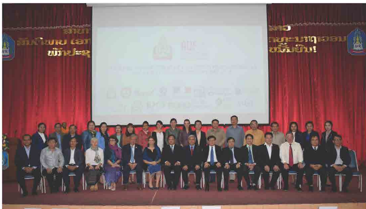
ພິທີເປີດ ໂຄງການສ້າງຄວາມເຂັ້ມແຂງໃຫ້ແກ່ການກ້າວເຂົ້າສູ່ວິຊາຊີບໂດຍຜ່ານການປຶກສາຫາລື ລະຫວ່າງ ມະຫາວິທະຍາໄລແຫ່ງຊາດ ແລະ ບລີສັດຕ່າງໆ ໃນວັນທີ 09 ກຸມພາ 2018 ທີ່ ມະຫາວິທະຍາໄລແຫ່ງຊາດ