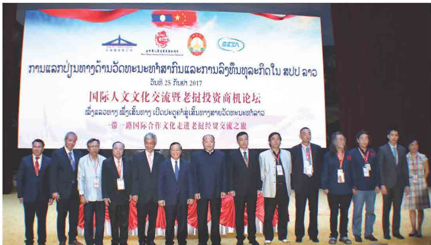
ກອງປະຊຸມ ການແລກປ່ຽນທາງດ້ານວັດທະນະທຳສາກົນ ແລະ ການລົງທຶນທຸລະກິດ ໃນ ສປປ ລາວ (ໜຶ່ງເສັ້ນທາງ ໜຶ່ງແລວທາງ ເປີດປະຕູຄຳສູ່ເສັ້ນທາງສາຍວັດທະນະທຳລາວ) ວັນທີ 25 ກັນຍາ 2017 ທີ່ ຫໍປະຊຸມແຫ່ງຊາດ