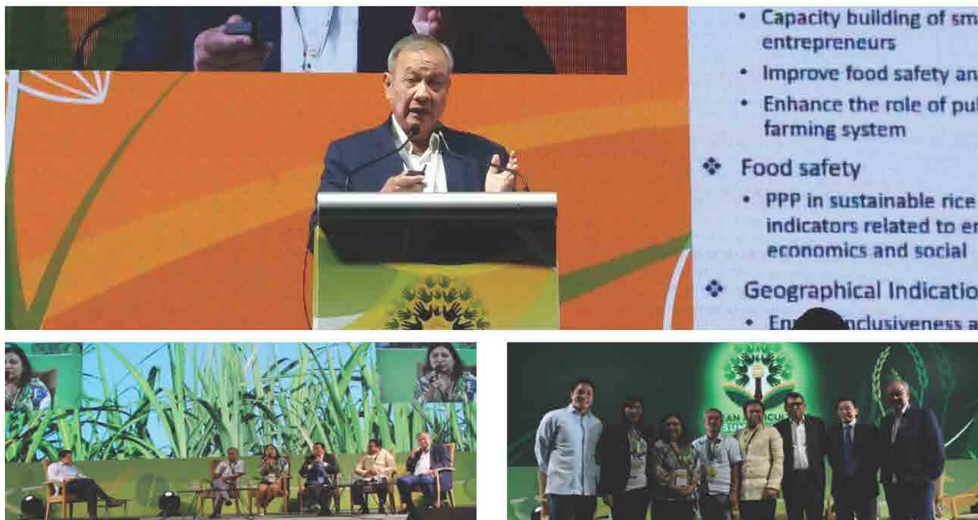
ກອງປະຊຸມ “ASEAN Agriculture Summit” ຈັດຂຶ້ນໃນວັນທີ 04 ຕຸລາ 2017 ທີ່ ປາໄຊ, ປະເທດ ຟີລິບປິນ