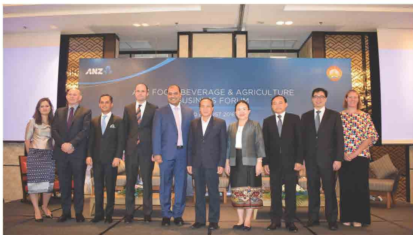
ສຳມະນາກ່ຽວກັບໂອກາດທາງທຸລະກິດດ້ານອາຫານ-ເຄື່ອງດື່ມ ແລະ ກະສິກຳໃນລາວ (ANZ Food, Beverage & Agriculture Business Forum)