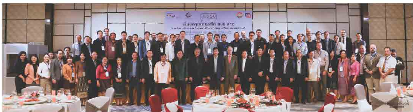
ກອງປະຊຸມພົບປະອາຫານເຊົ້າ ເພື່ອຮັບຟັງ ສະພາບເສດຖະກິດຂອງ ສປປ ລາວ ໃນປັດຈຸບັນ ແລະ ທິດທາງໃນອານາຄົດ ວັນທີ 30 ຕຸລາ 2018 ທີ່ ຄຣາວພາຊາ, ນະຄອນຫຼວງວຽງຈັນ