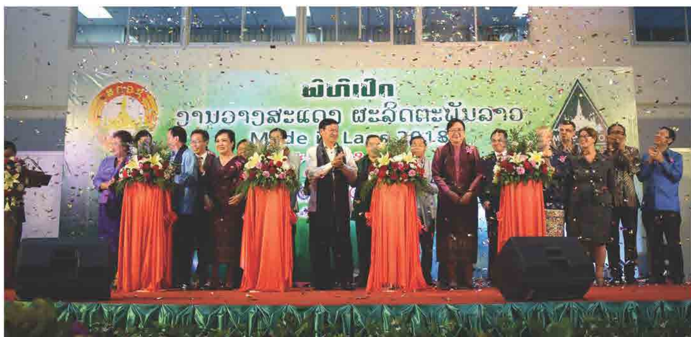
ພິທີເປີດ ງານວາງສະແດງ ຜະລິດຕະພັນລາວ Made in Laos 2018 ວັນທີ 14 ມີນາ 2018 ທີ່ ສູນການຄ້າ ລາວໄອເຕັກ