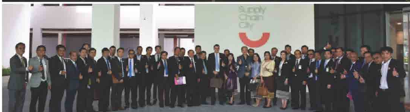
ກອງປະຊຸມ “Investment Opportunities in Laos” ໃນວັນທີ 10 ພຶດສະພາ 2018 ທີ່ ຊັບຟາຍເຈນຊີຕີ້ ປະເທດສິງກະໂປ