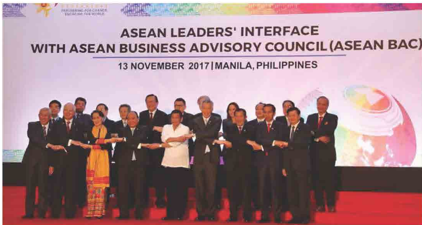
ກອງປະຊຸມ ASEAN LEADERS' INTERFACE WITH ASEAN BUSINESS ADVISORY COUNCIL (ASEAN BAC) ວັນທີ 13 ພະຈິກ 2017 ທີ່ ມະນິລາ, ປະເທດ ຟີລິບປິນ