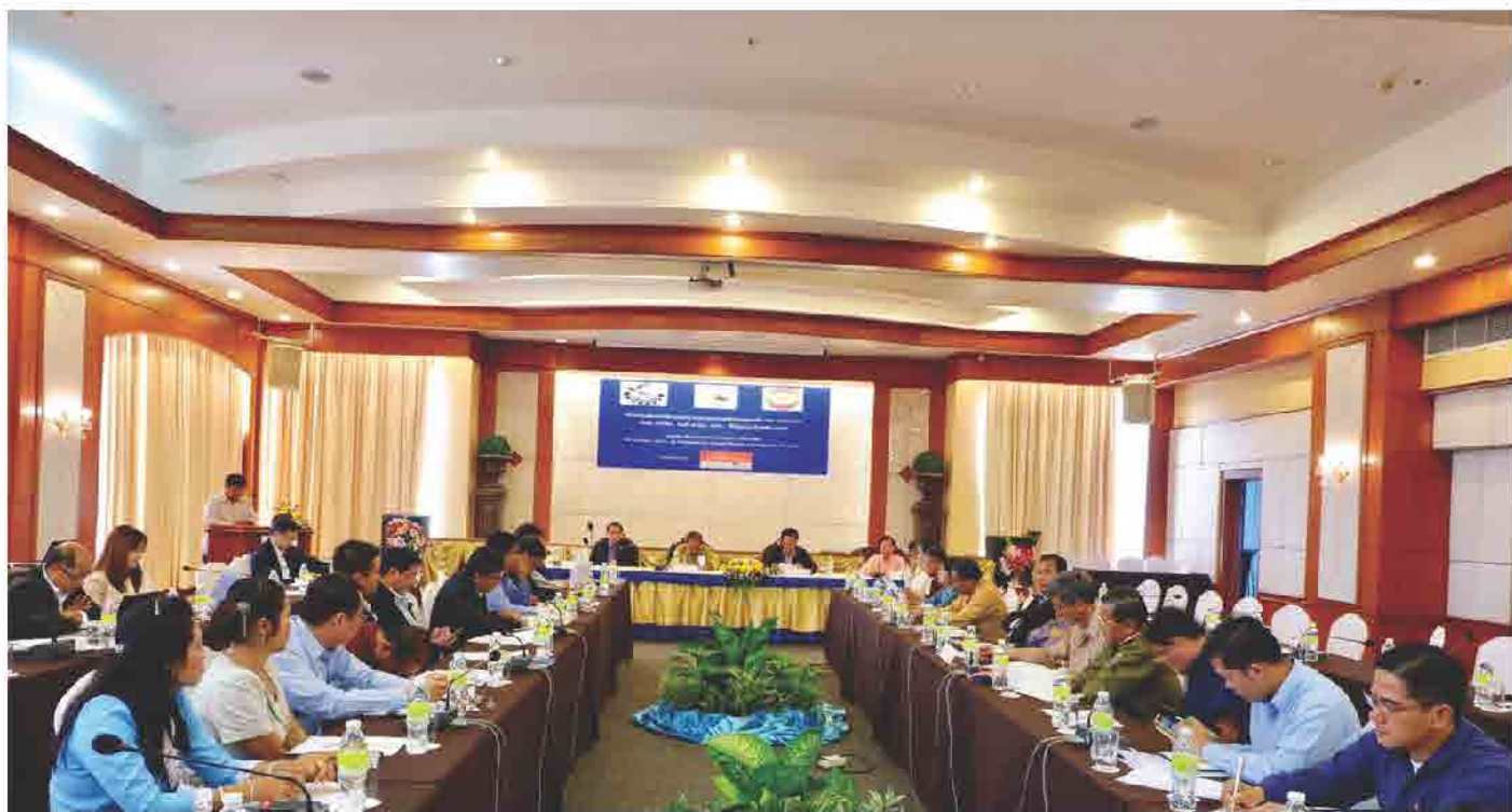
ກອງປະຊຸມປຶກສາຫາລື ພາກລັດພາກທຸລະກິດ ຂັ້ນແຂວງ ໃນວັນທີ 19 ຕຸລາ 2017 ທີ່ ໂຮງແຮມ ຈຳປາສັກແກຣນ, ແຂວງຈຳປາສັກ