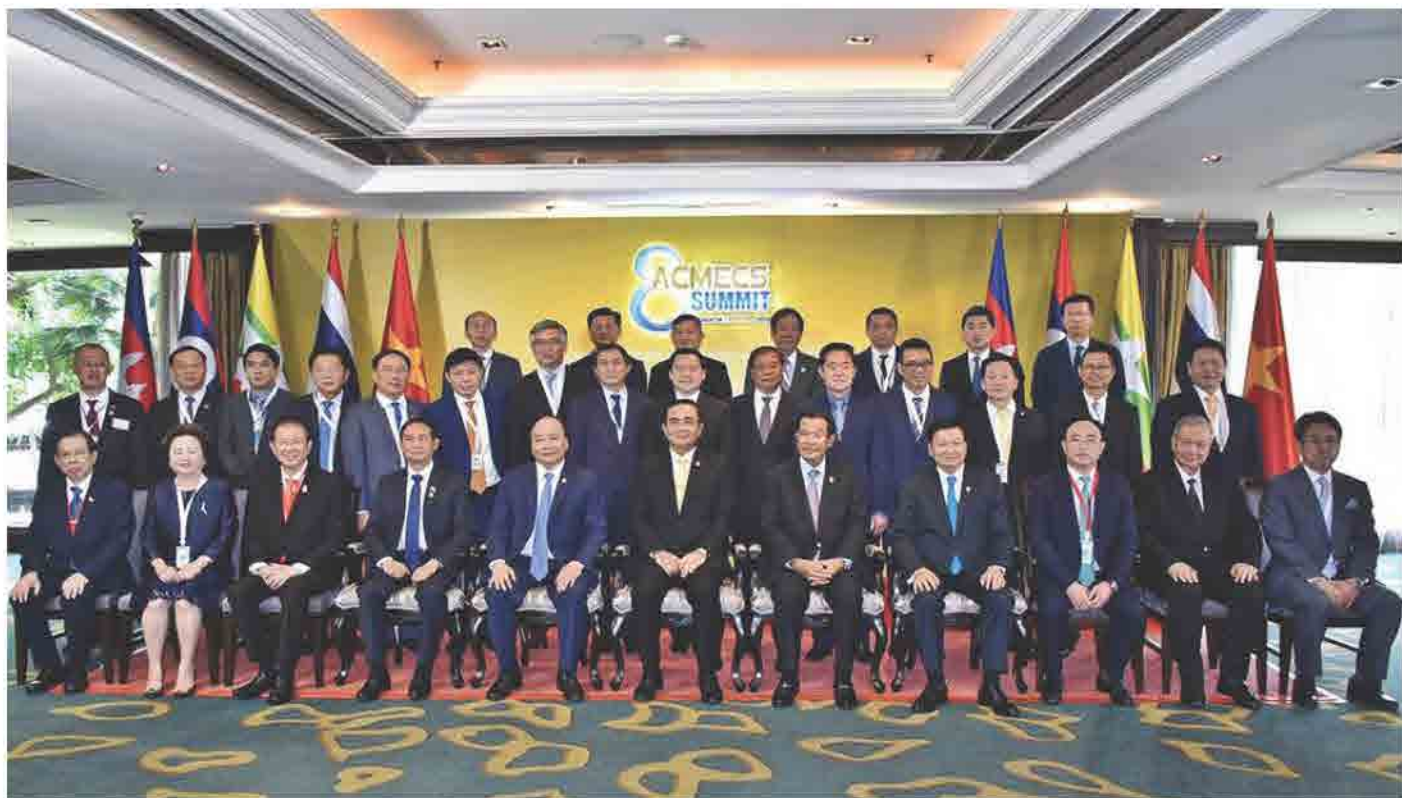
ກອງປະຊຸມສຸດຍອດ ACMECS ຄັ້ງທີ 8 ແລະ ກອງປະຊຸມສຸດຍອດ CLMV ຄັ້ງທີ 9 ໃນວັນທີ 16 ມິຖຸນາ 2018 ທີ່ ໂຮງແຮມ ແຊງກຣີ-ລາ, ບາງກອກ, ປະເທດໄທ