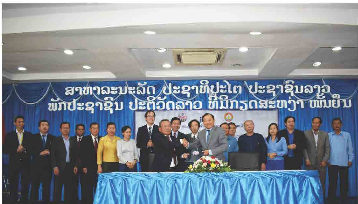
ພິທີເຊັນບົດບັນທຶກຊ່ວຍຈຳວ່າດ້ວຍ ວຽກງານການຮ່ວມມືລະຫວ່າງ ສະພາການຄ້າ ແລະ ອຸດສາຫະກຳ ແຫ່ງຊາດລາວ ແລະ ທະນາຄານພັດທະນາລາວ ໃນວັນທີ 11 ພຶດສະພາ 2018 ທີ່ ສຳນັກງານໃຫຍ່ ທະນາຄານພັດທະນາລາວ