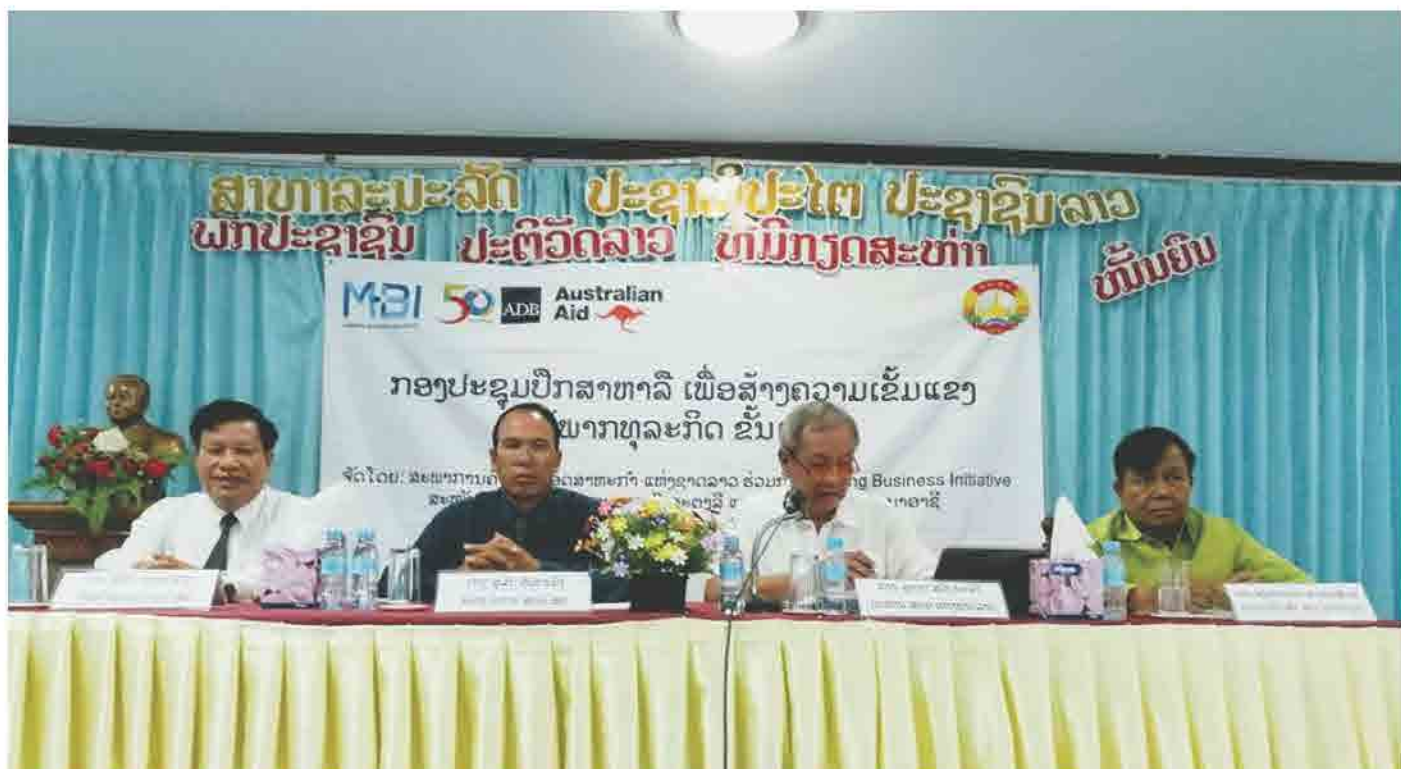
ກອງປະຊຸມ ປຶກສາຫາລື ສ້າງຄວາມເຂັ້ມແຂງ ໃຫ້ພາກທຸລະກິດຂັ້ນແຂວງ ທີ່ ແຂວງ ສະຫວັນນະເຂດ ປີ 2017