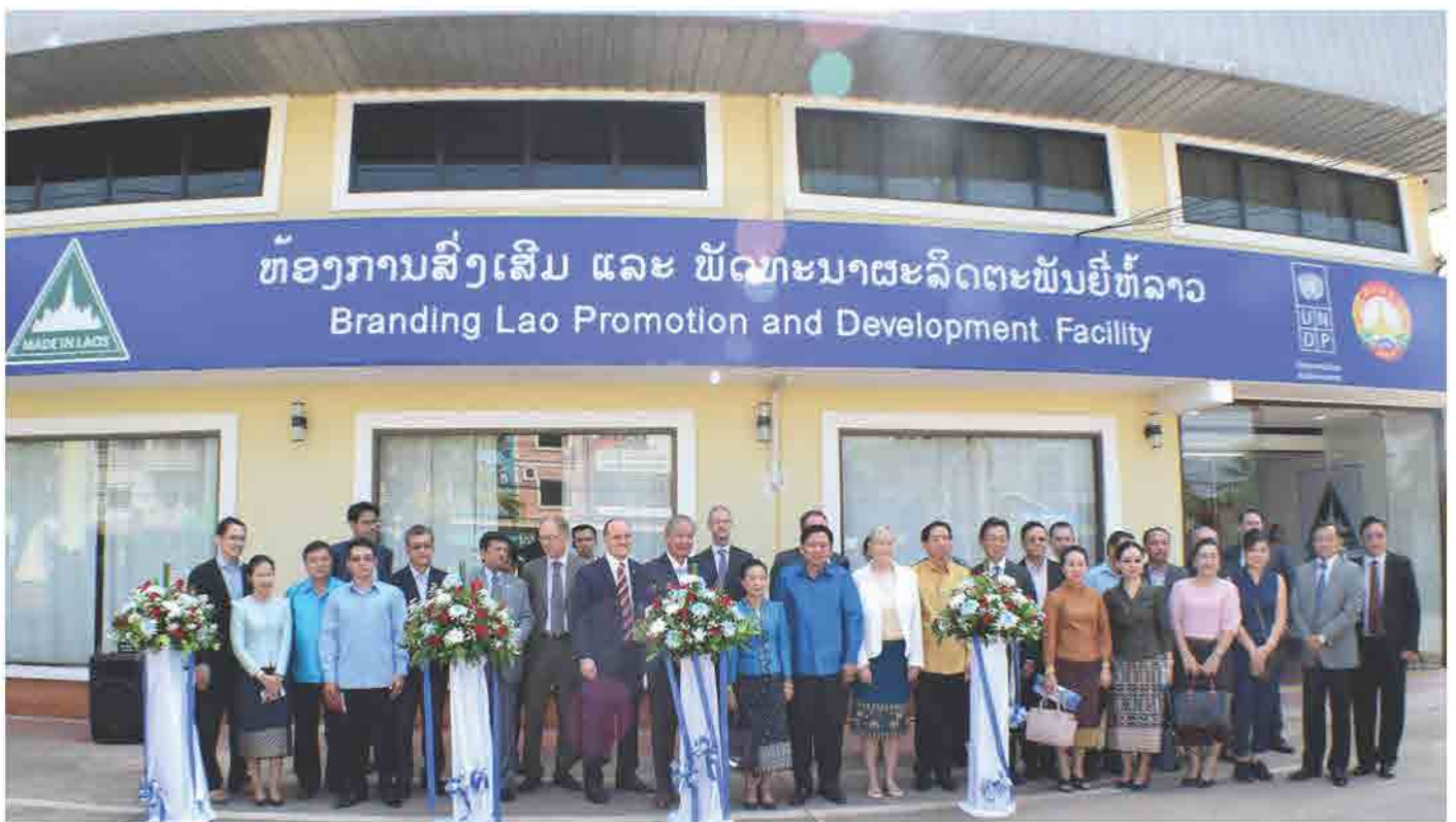
ພິທີເປີດ ຫ້ອງການສົ່ງເສີມ ແລະ ພັດທະນາຜະລິດຕະພັນຢູ່ຫ້ລາວ (Branding Lao Promotion and Development Facility Office) ຢ່າງເປັນທາງການ ໃນວັນທີ 02 ພະຈິກ 2017 ທີ່ ສະພາການຄ້າ ແລະ ອຸດສາຫະກຳ ແຫ່ງຊາດລາວ