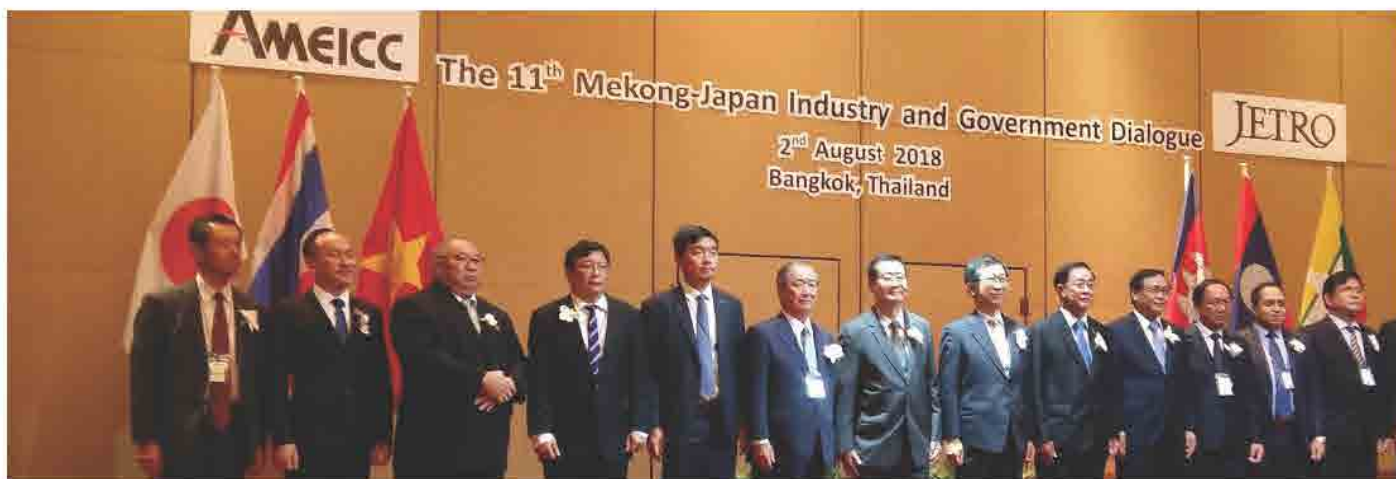
ກອງປະຊຸມ The 11th Mekong-Japan Industry and Government Dialogue ວັນທີ 02 ສິງຫາ 2018 ທີ່ ບາງກອກ ປະເທດ ໄທ