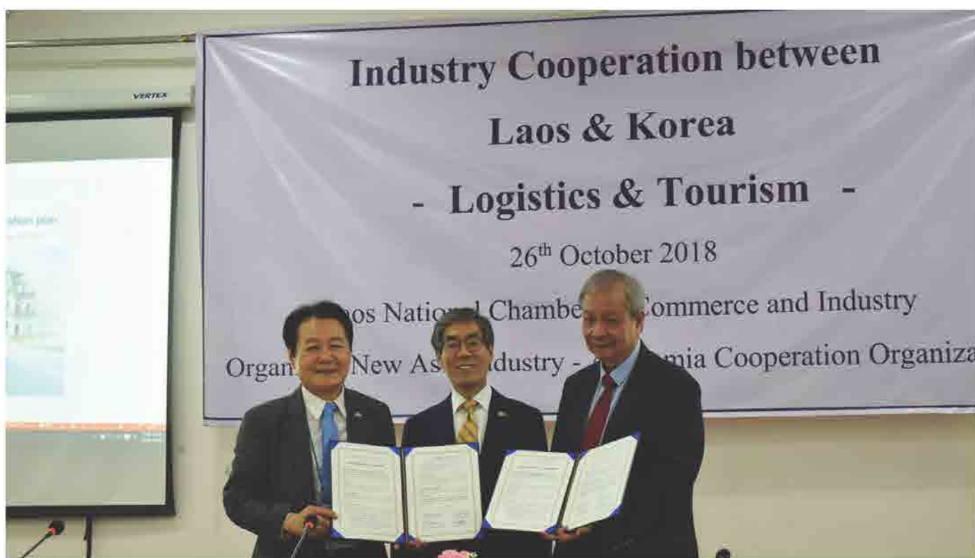
ພິທີເຊັນສັນຍາບັນທຶກຄວາມເຂົ້າໃຈ ໃນການຮ່ວມມືລະຫວ່າງສອງຝ່າຍ Industry Cooperation between Laos & Korea "Logistic & Tourism" ວັນທີ 26 ຕຸລາ 2018 ທີ່ ສຄອຊ