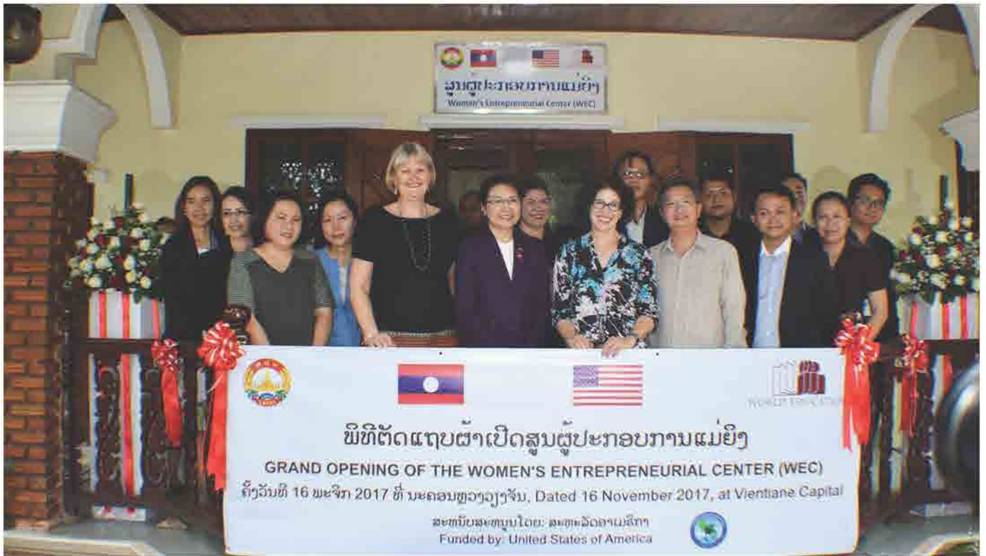
ພິທີເປີດ ສູນຜູ້ປະກອບການແມ່ຍິງ ຢ່າງເປັນທາງການ ໃນວັນທີ 16 ພະຈິກ 2017 ທີ່ ນະຄອນຫຼວງວຽງຈັນ