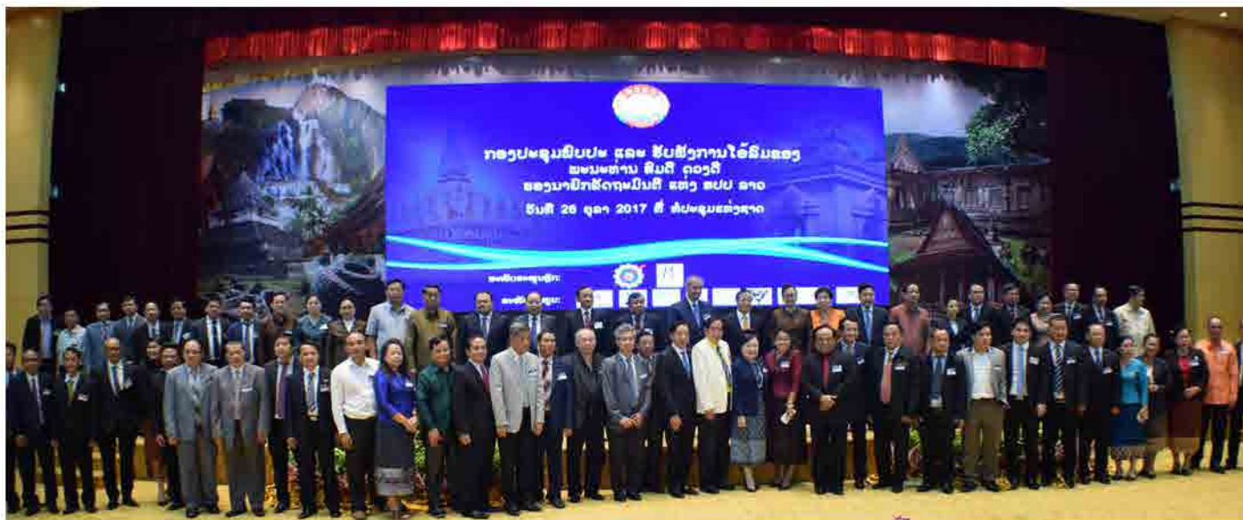
ກອງປະຊຸມພົບປະ ແລະ ຮັບຟັງການໂອ້ລົມຂອງ ທ່ານ ສົມດີ ດວງດີ, ຮອງນາຍົກລັດຖະມົນຕີ ແຫ່ງ ສປປ ລາວ ວັນທີ 26 ຕຸລາ 2017 ທີ່ ຫໍປະຊຸມແຫ່ງຊາດ