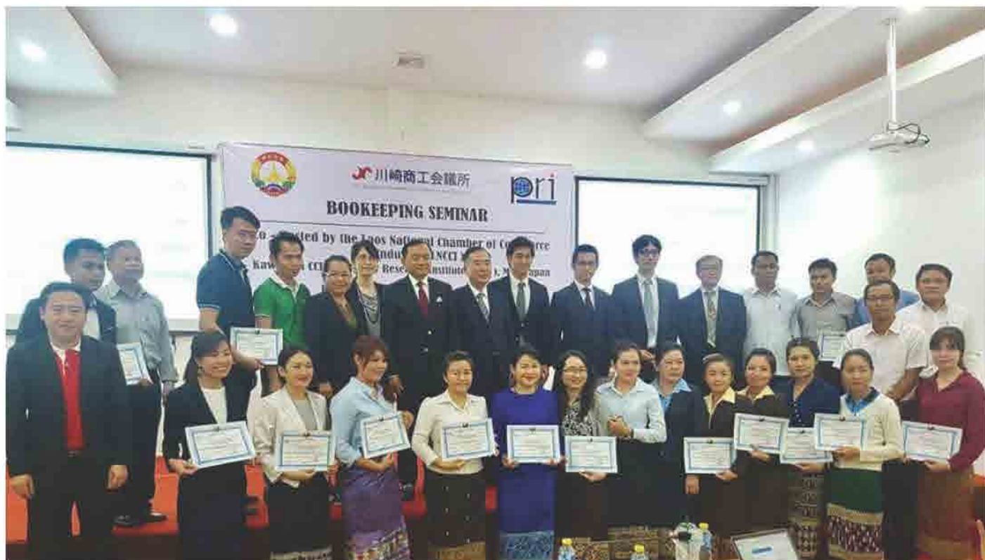
ສຳມະນາ ການຈົດກຳບັນຊີ (BOOKEEPING SEMINAR) ທີ່ ສະພາການຄ້າ ແລະ ອຸດສາຫະກຳ ແຫ່ງຊາດລາວ