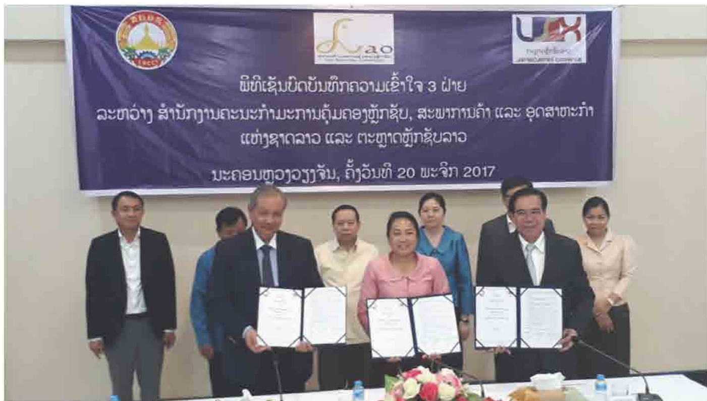
ພິທີເຊັນບົດບັນທຶກຄວາມເຂົ້າໃຈ 3 ຝ່າຍ ລະຫວ່າງ ສຳນັກງານຄະນະກຳມະການຄຸ້ມຄອງຫຼັກຊັບ, ສະພາການຄ້າ ແລະ ອຸດສາຫະກຳ ແຫ່ງຊາດລາວ ແລະ ຕະຫຼາດຫຼັກຊັບລາວ ນະຄອນຫຼວງວຽງຈັນ, ຄັ້ງວັນທີ 20 ພະຈິກ 2017