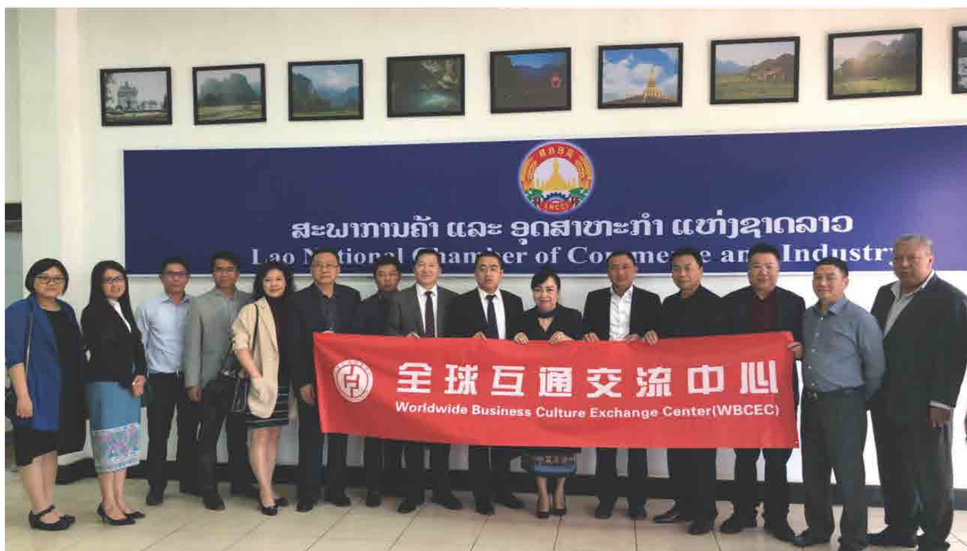
ຮອງປະທານ ສຄອຊ ຕ້ອນຮັບ ຄະນະຜູ້ແທນ WBCEC ປີ 2018