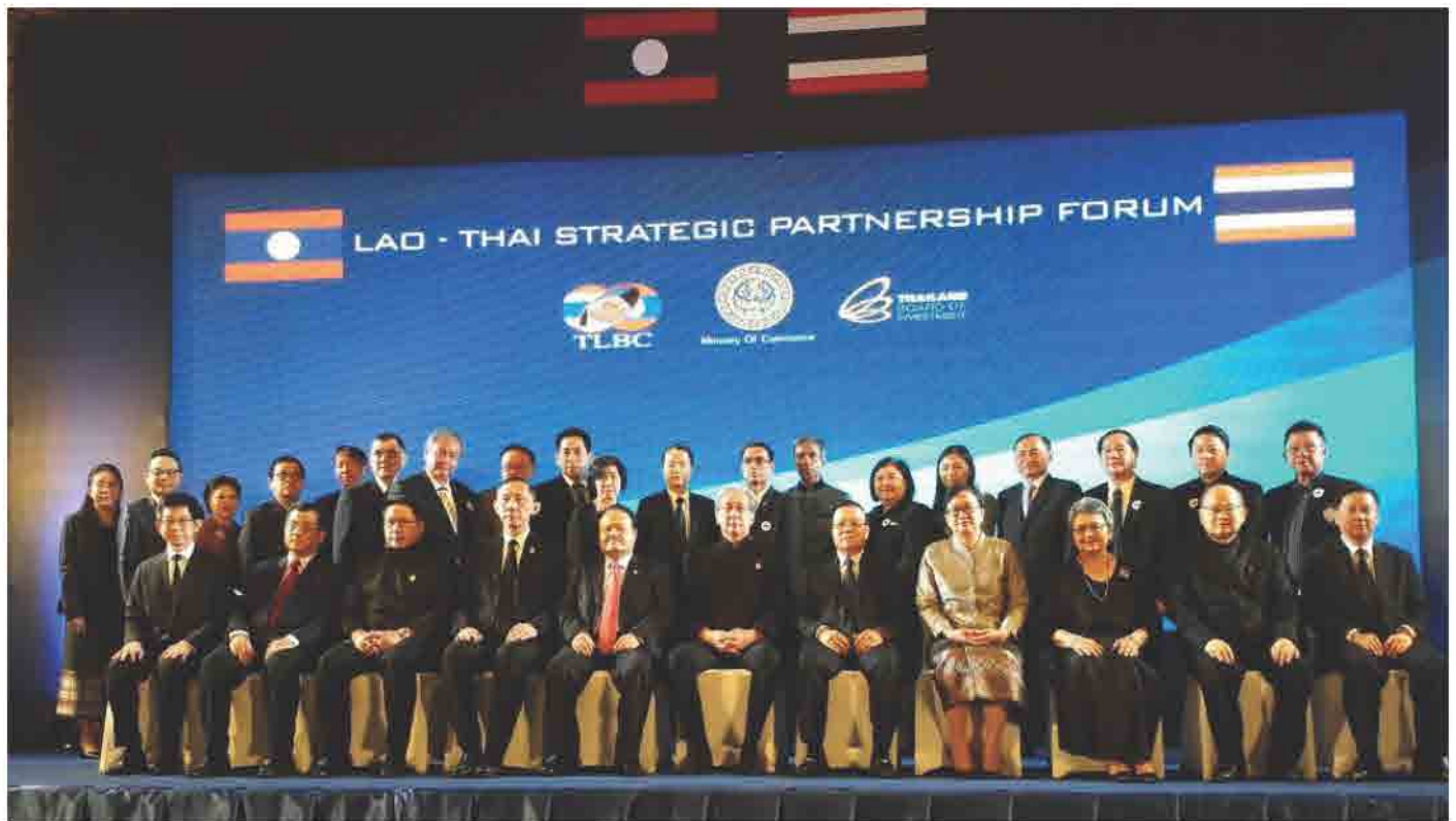
ກອງປະຊຸມຄູ່ຮ່ວມຍຸດທະສາດການຮ່ວມມື ລາວ-ໄທ ໃນວັນທີ 25 ພຶດສະພາ 2017 ເພື່ອຕ້ອນຮັບການເດີນທາງມາຢ້ຽມຢາມ ສປປ ລາວ ຢ່າງເປັນທາງການ ຂອງ ພະນະທານ ສົມຄິດ ຈະຕຸສິພິທັກ ຮອງນາຍົກລັດຖະມົນຕີ ແຫ່ງຣາຊາອານາຈັກໄທ