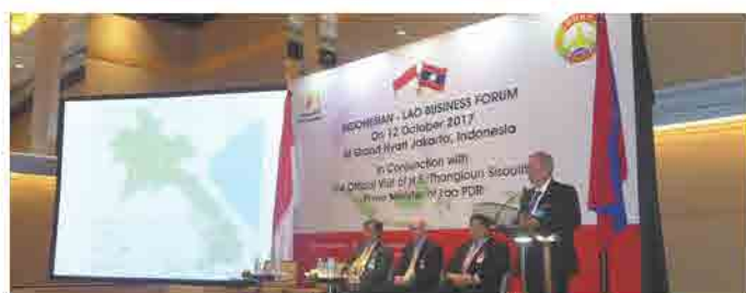
ຄະນະນັກທຸລະກິດ ຕິດຕາມ ຄະນະຜູ້ແທນລາວນຳໂດຍ ທ່ານ ນາຍົກລັດຖະມົນຕີ ແຫ່ງ ສປປ ລາວ ຢ້ຽມຢາມ ປະເທດ ອິນໂດເນເຊຍ ໃນລະຫວ່າງ ວັນທີ 11-12 ຕຸລາ 2017