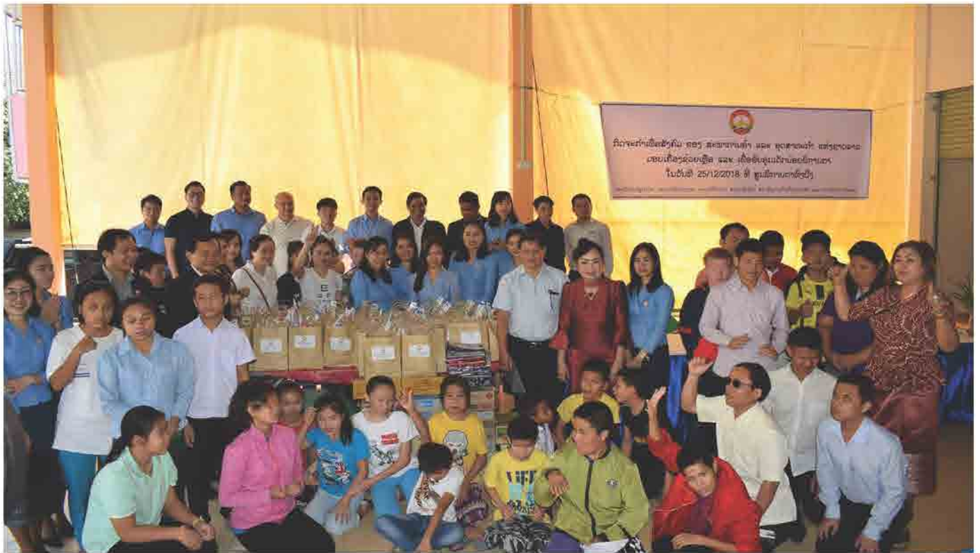
ສະພາການຄ້າ ແລະ ອຸດສາຫະກຳ ແຫ່ງຊາດລາວ ມອບເຄື່ອງຊ່ວຍເຫຼືອ ເດັກນ້ອຍພິການທາງສາຍຕາ ປີ 2018 ວັນທີ 25 ທັນວາ 2018 ທີ່ ສູນພິການຕາທົ່ງປົງ