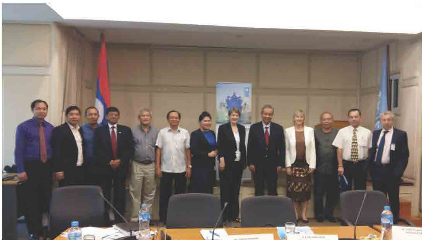
ກອງປະຊຸມພົບປະ UNDP ເພື່ອລິເລີ່ມໂຄງການ Branding Lao ປີ 2017