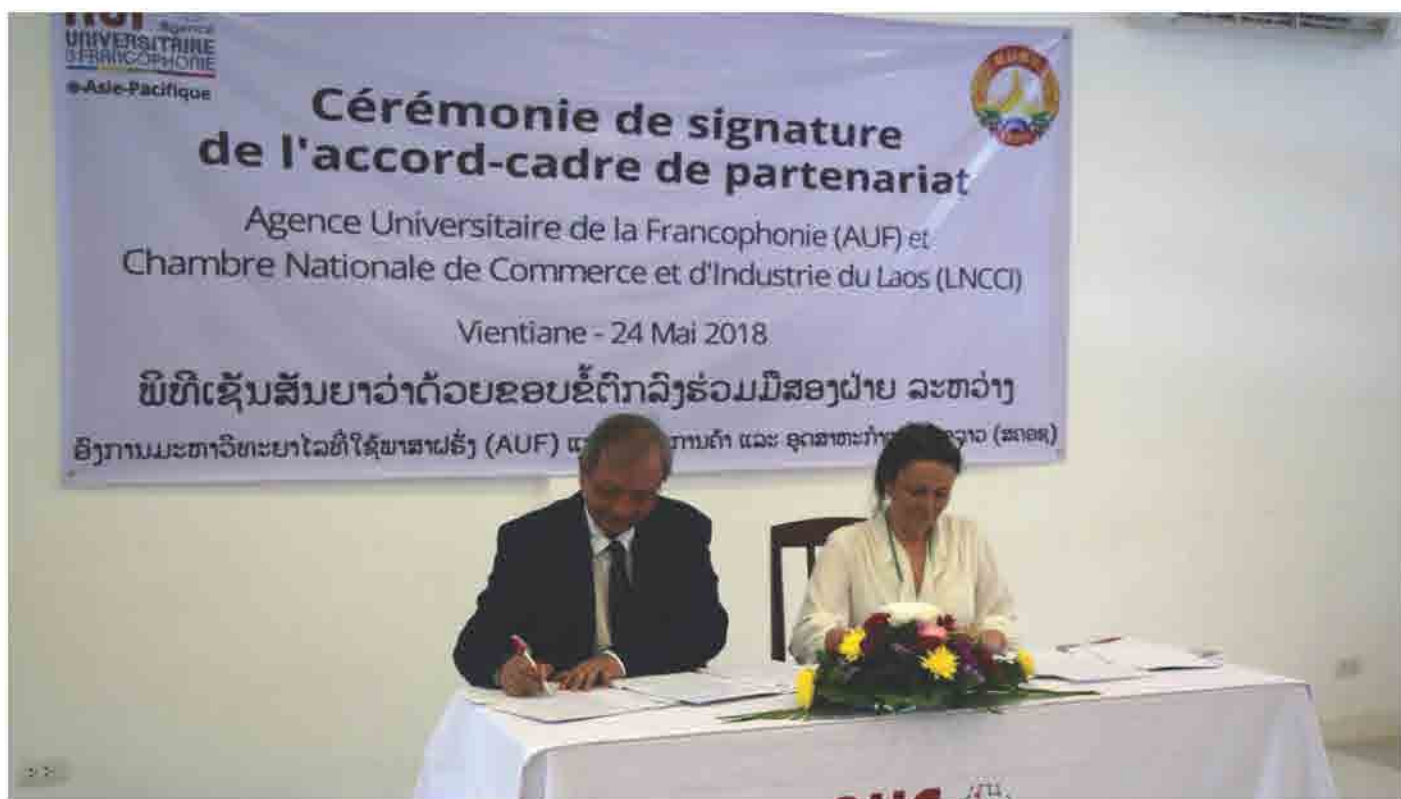
ພິທີເຊັນສັນຍາວ່າດ້ວຍຂອບຂໍ້ຕົກລົງຮ່ວມມືສອງຝ່າຍ ລະຫວ່າງ ອົງການມະຫາວິທະຍາໄລທີ່ໃຊ້ພາສາຝຣັ່ງ ແລະ ສະພາການຄ້າ ແລະ ອຸດສາຫະກຳ ແຫ່ງຊາດລາວ ວັນທີ 24 ພຶດສະພາ 2018 ທີ່ ມະຫາວິທະຍາໄລແຫ່ງຊາດລາວ