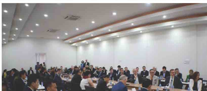
ກອງປະຊຸມການສົ່ງເສີມການຮ່ວມມືດ້ານເສດຖະກິດ-ການຄ້າ ລະຫວ່າງ ລາວ-ສະໂລວັກ ໃນວັນທີ 16 ມັງກອນ 2018