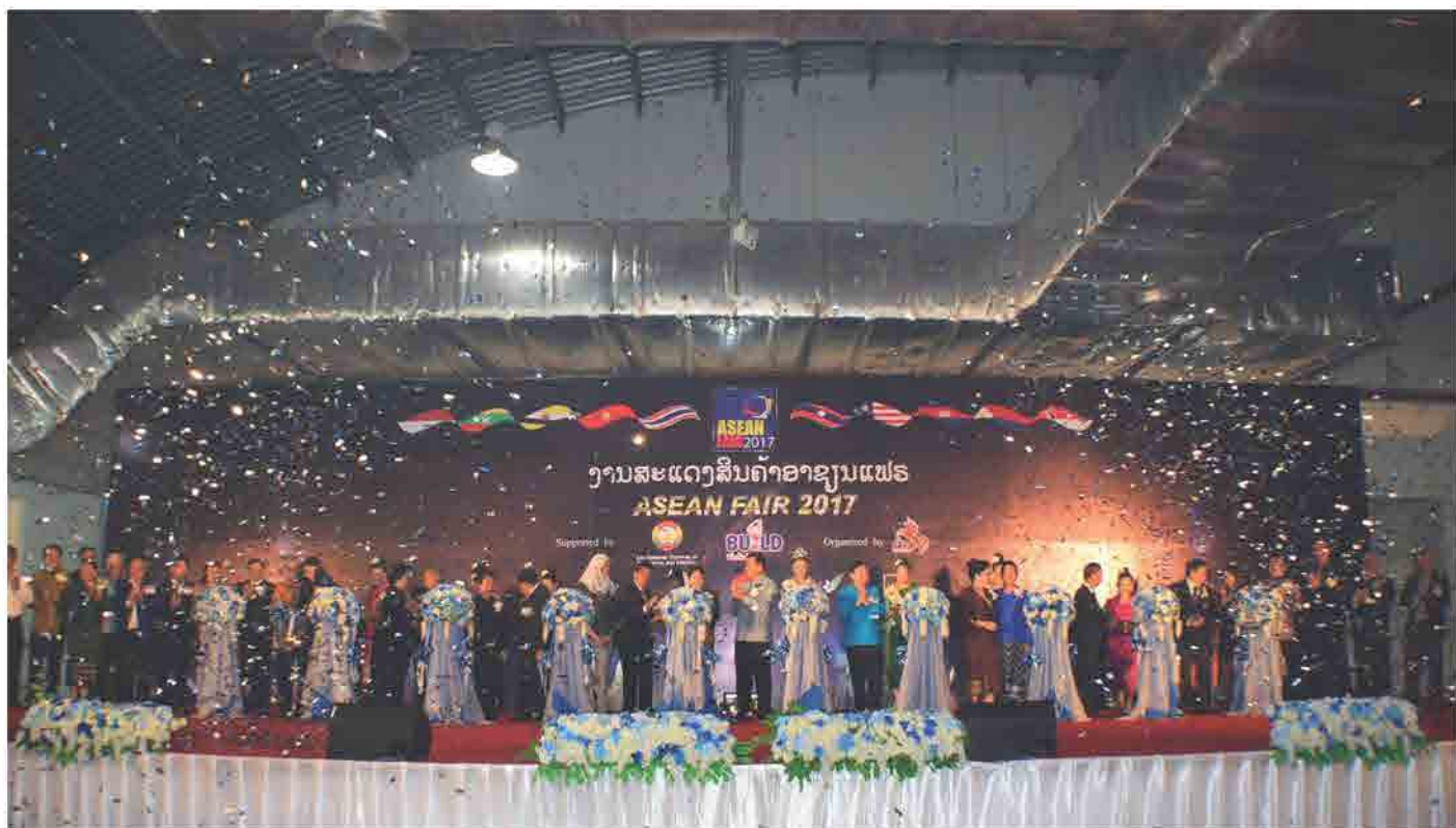
ພິທີເປີດງານວາງສະແດງສິນຄ້າ ASEAN FAIR 2017 ວັນທີ 13 ຕຸລາ 2017 ທີ່ ສູນການຄ້າສະຫວັນ-ໄອເຕັກ, ແຂວງສະຫວັນນະເຂດ