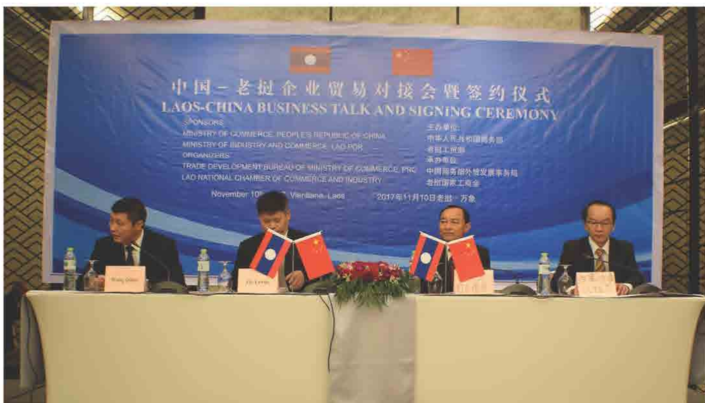
ກອງປະຊຸມ Laos-China Business Talk and Signing Ceremony ວັນທີ 10 ພະຈິກ 2017 ທີ່ ນະຄອນຫຼວງວຽງຈັນ.