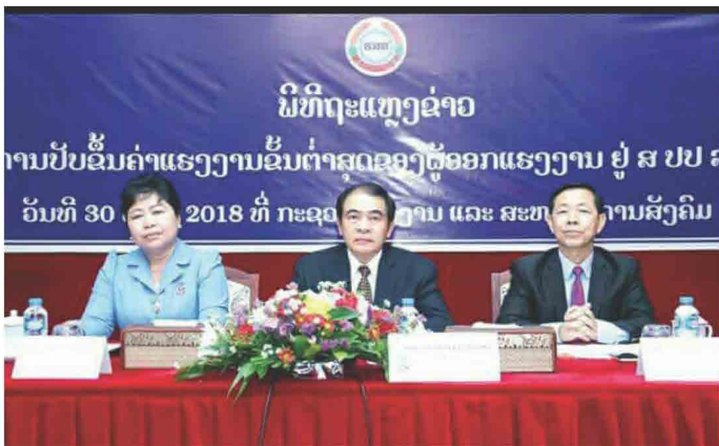
ພິທີຖະແຫຼງຂ່າວການປັບຄ່າແຮງງານຂັ້ນຕໍ່າສຸດຂອງຜູ້ອອກແຮງງານ ຢູ່ ສປປ ລາວ ວັນທີ 30 ເມສາ 2018 ທີ່ ກະຊວງແຮງງານ ແລະ ສະຫວັດດີການສັງຄົມ