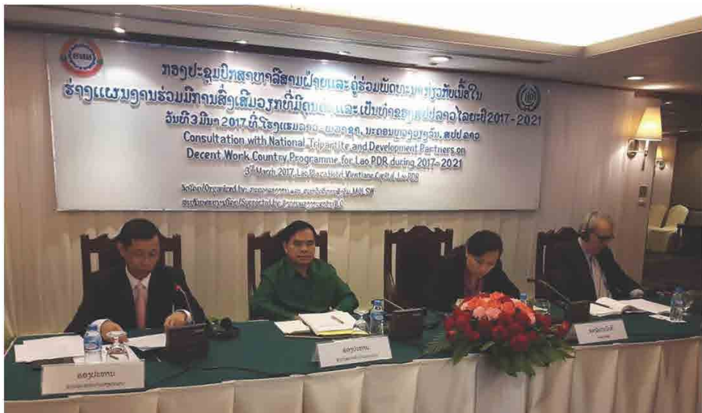
ກອງປະຊຸມປຶກສາຫາລືສາມຝ່າຍ ແລະ ຄູ່ຮ່ວມພັດທະນາກ່ຽວກັບເນື້ອໃນ ຮ່າງແຜນງານຮ່ວມມືການສົ່ງເສີມວຽກທີ່ມີຄຸນ ແລະ ເປັນທ່າຂອງສປປ ລາວ ໄລຍະ 2017-2021 ວັນທີ 3 ມີນາ 2017