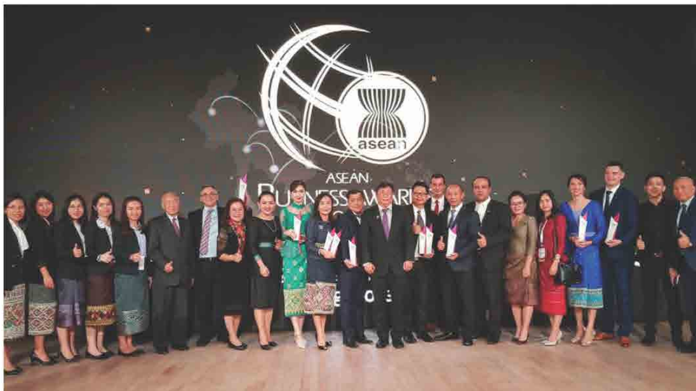
ພິທີມອບ ລາງວັນທຸລະກິດດີເດັ່ນອາຊຽນ 2018 ທີ່ ປະເທດ ສິງກະໂປ