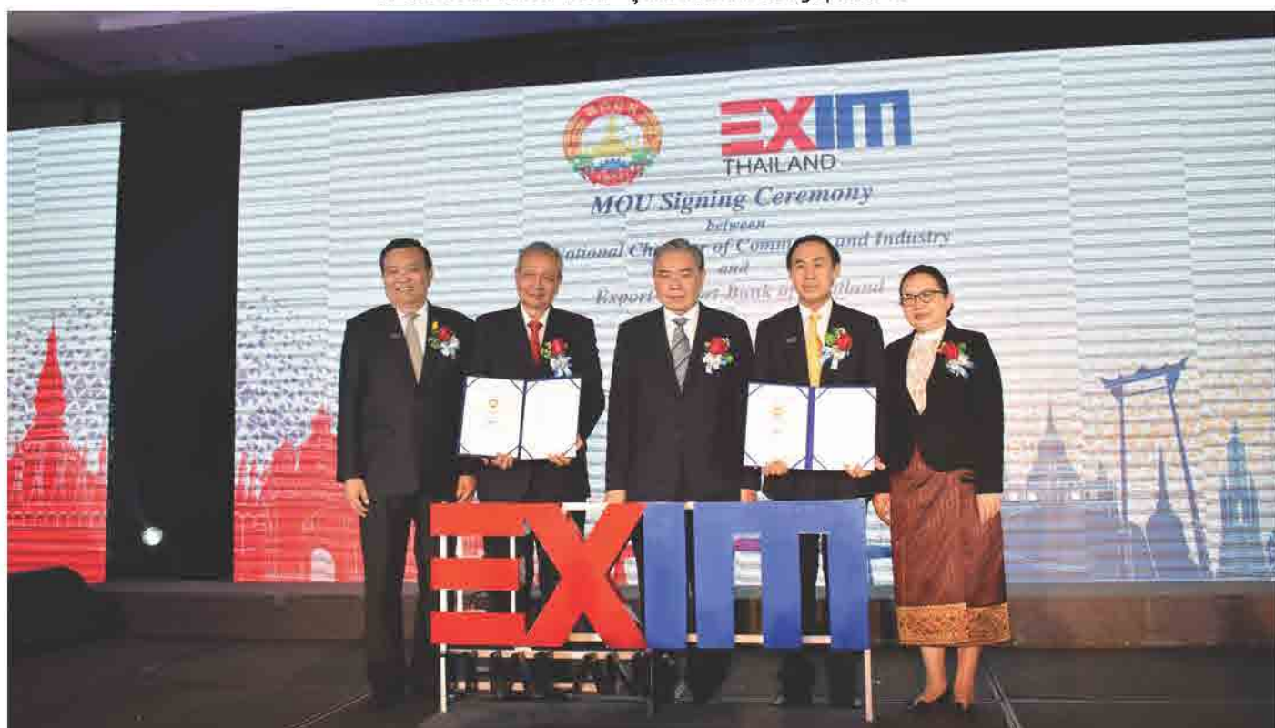
ພິທີເຊັນບົດບັນທຶກຄວາມເຂົ້າໃຈ ສະພາການຄ້າ ແລະ ອຸດສາຫະກຳ ແຫ່ງຊາດລາວ ແລະ ທະນາຄານ ເອັກຊິມ ວັນທີ 30 ພະຈິກ 2018 ທີ່ ໂຮງແຮມ ຄຣາວພາຊາ, ນະຄອນຫຼວງວຽງຈັນ