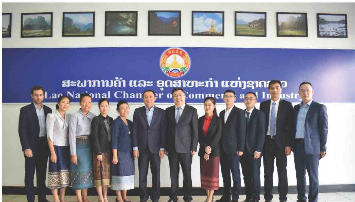
ຕ້ອນຮັບ ຄະນະບໍລິຫານງານ ຈາກສະພາສົ່ງເສີມການຄ້າສາກົນ, ແຂວງເຈົ້າຈຽງ (CCPAT) ໃນວັນທີ 16 ພະຈິກ 2018