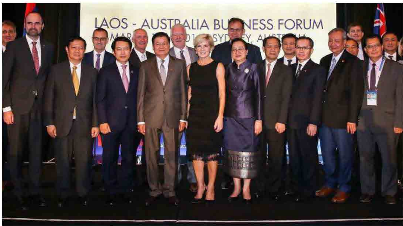
ກອງປະຊຸມພົບປະ ທຸລະກິດ ລາວ-ອົດສະຕາລີ ທີ່ ນະຄອນ ຊິດນີ, ປະເທດ ອົດສະຕາລີ