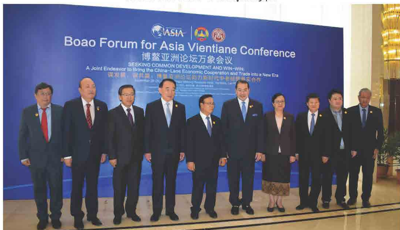
ກອງປະຊຸມ Boao Forum For Asia Vientiane Conference ວັນທີ 28 ຕຸລາ 2018, ທີ່ ໂຮງແຮມ ແລນມາກ, ນະຄອນຫຼວງວຽງຈັນ.