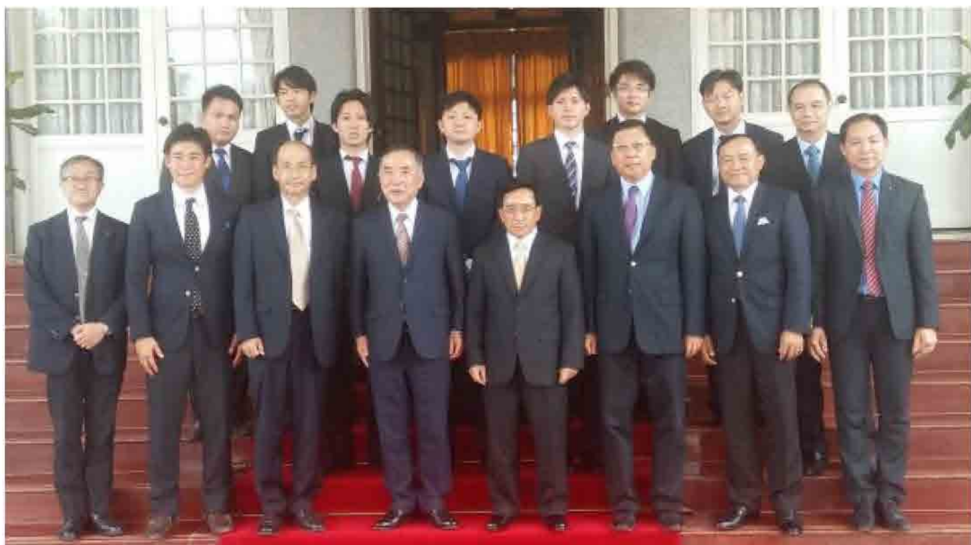
ນຳພາສະພາການຄ້າ ກາວາສະກີ, ປະເທດຍີ່ປຸ່ນ ເຂົ້າຢ້ຽມຄຳນັບ ທ່ານ ພັນຄຳ ວິພາວັນ ຮອງປະທານປະເທດ ແຫ່ງ ສປປ ລາວ