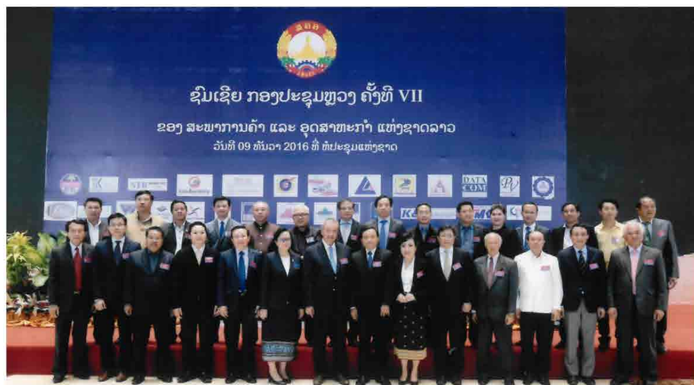
ກອງປະຊຸມຫຼວງ ຄັ້ງທີ VII ຂອງ ສະພາການຄ້າ ແລະ ອຸດສາຫະກຳ ແຫ່ງຊາດລາວ ວັນທີ 09 ທັນວາ 2016