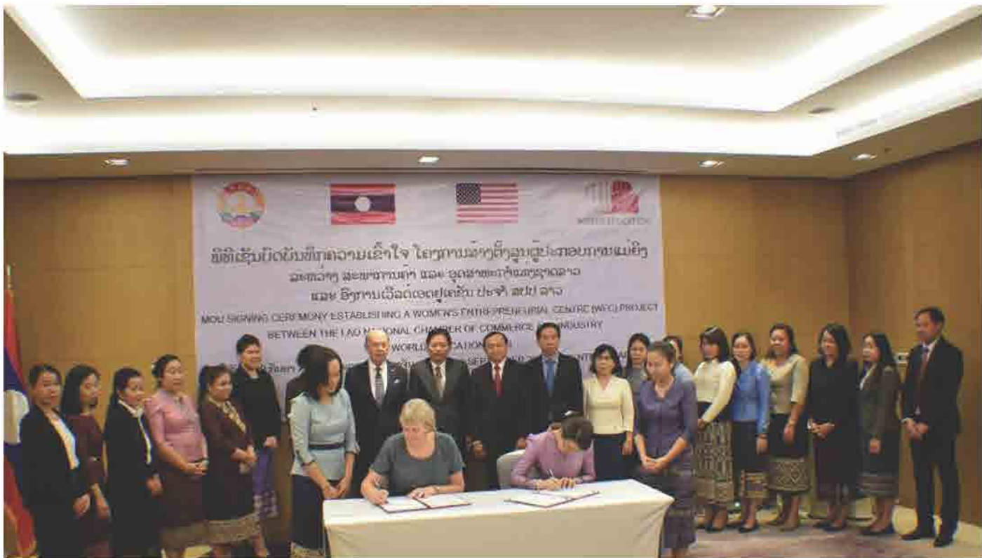
ພິທີເຊັນບົດບັນທຶກຄວາມເຂົ້າໃຈ ໂຄງການສ້າງຕັ້ງສູນປະກອບການແມ່ຍິງ ສະຫວ່າງ ສະພາການຄ້າ ແລະ ອຸດສາຫະກຳ ແຫ່ງຊາດລາວ ແລະ ອົງການເວີລດເອດຢູເຄຊັນ ປະຈຳລາວ ປີ 2018