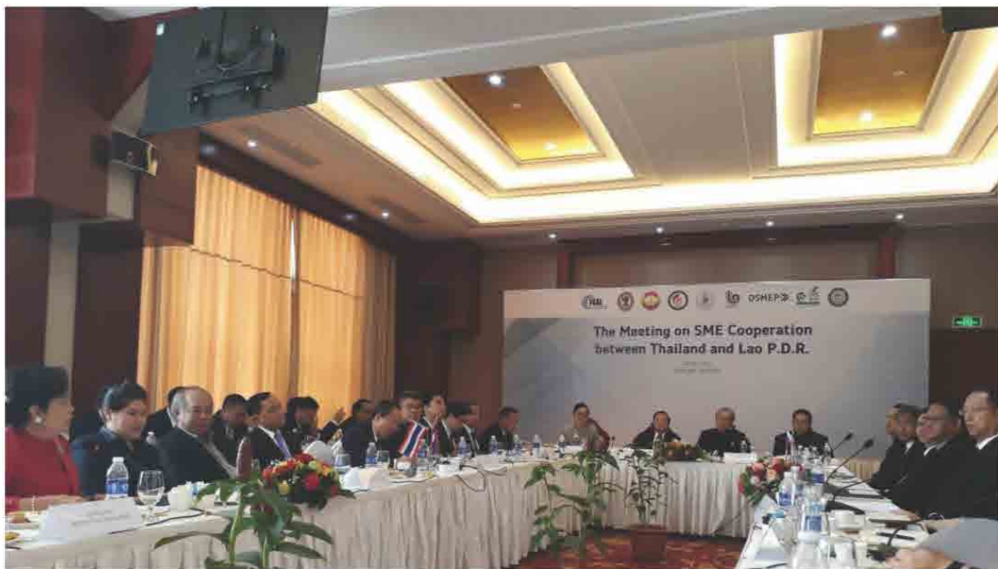
ກອງປະຊຸມ The Meeting on SME Cooperation between Thailand and Lao P.D.R ວັນທີ 25 ພຶດສະພາ 2017 ທີ່ ນະຄອນຫຼວງວຽງຈັນ