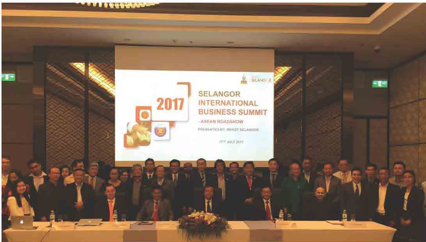
ກອງປະຊຸມພົບປະທຸລະກິດ ລາວ-ມາເລເຊຍ SELANGOR INTERNATIONAL BUSINESS SUMMIT ວັນທີ 17 ກໍລະກົດ 2017 ທີ່ ນະຄອນຫຼວງວຽງຈັນ