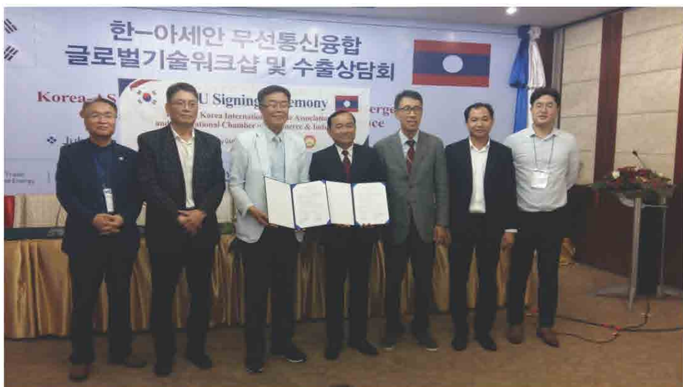
ພິທີເຊັນບົດບັນທຶກຊ່ວຍຈຳວ່າດ້ວຍ ວຽກງານການຮ່ວມມືລະຫວ່າງ ສະພາການຄ້າ ແລະ ອຸດສາຫະກຳ ແຫ່ງຊາດລາວ ແລະ ສະມາຄົມສົ່ງເສີມການຄ້າສາກົນ ສປປ ເກົາຫລີ ປີ 2017