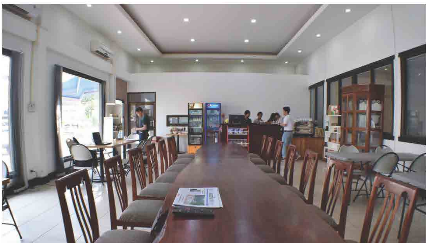
ຫ້ອງກາເຟ ຂອງ ສຄອ ແຫ່ງຊາດລາວ