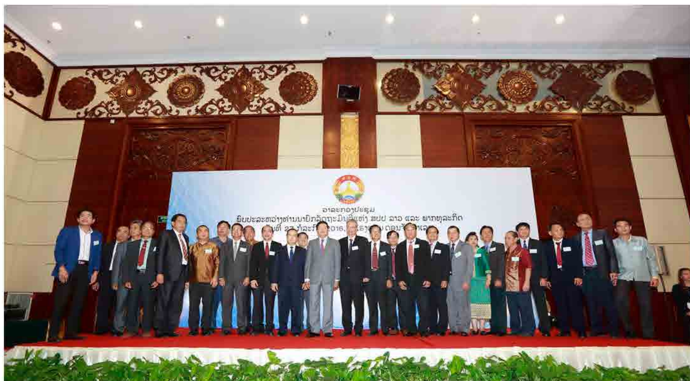
ກອງປະຊຸມພົບປະ ລະຫວ່າງ ທ່ານນາຍົກລັດຖະມົນຕີ ແຫ່ງ ສປປ ລາວ ແລະ ພາກທຸລະກິດ ວັນທີ 27 ກໍລະກົດ 2016 ທີ່ ໂຮງແຮມ ດອນຈັນພາເລດ