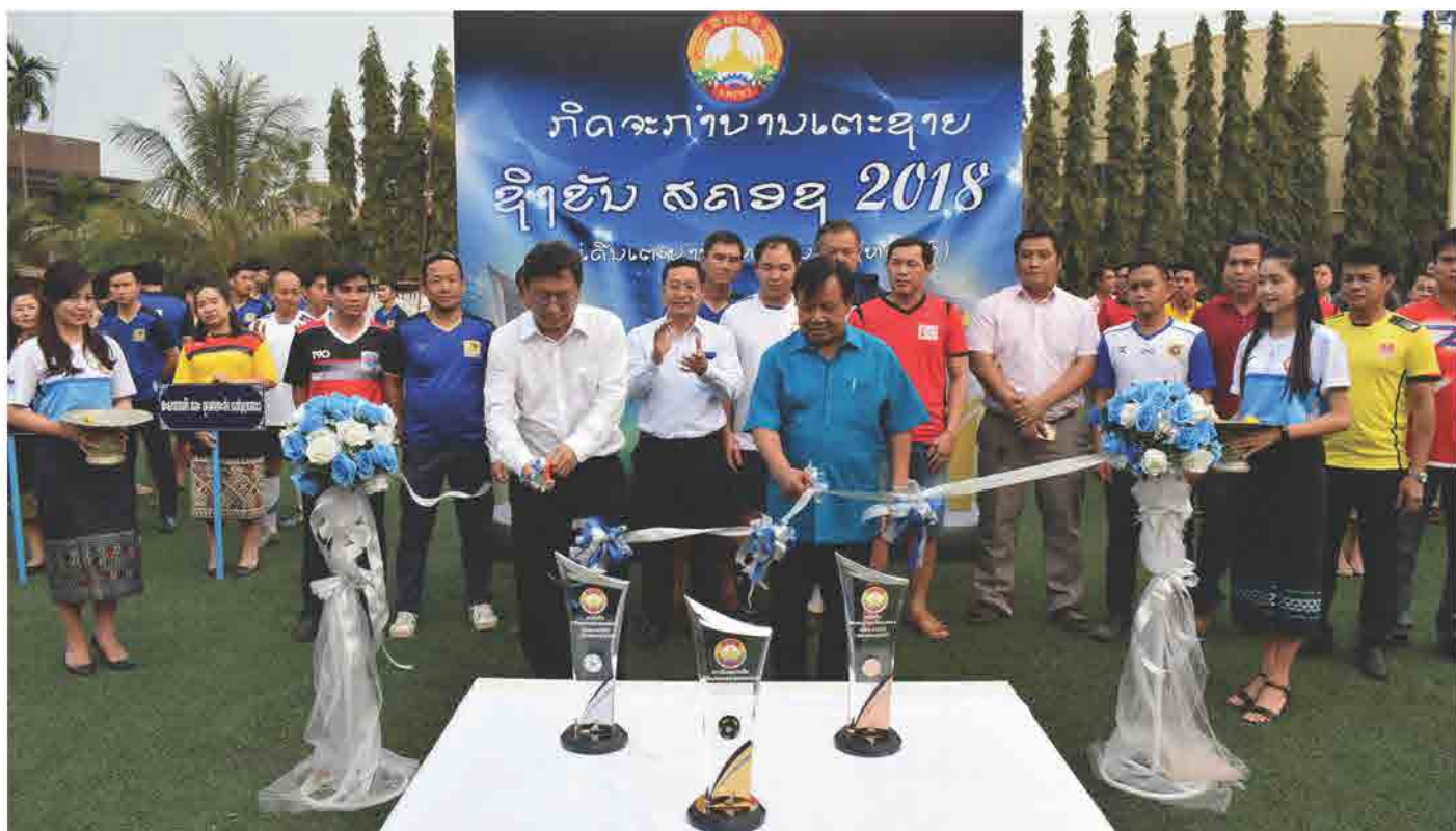
ກິດຈະກຳບານເຕະຊາຍ ຊິງຂັນ ສຄອຊ 2018