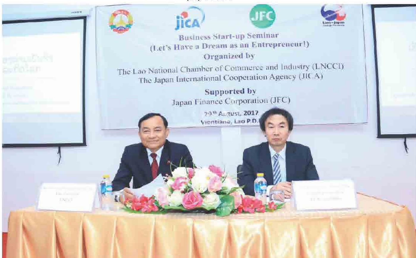
ສຳມະນາ Business Start-UP Seminar ປີ 2017