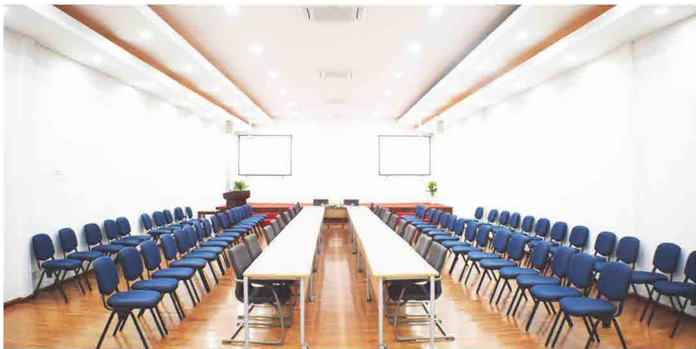
ຫ້ອງກອງປະຊຸມ ໃຫຍ່ ຂອງ ສຄອ ແຫ່ງຊາດລາວ