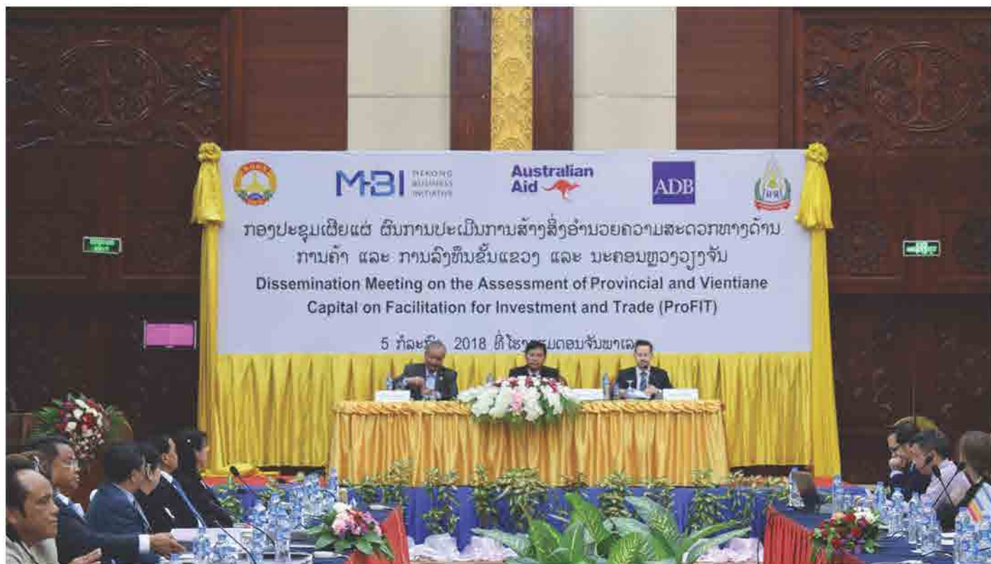
ກອງປະຊຸມ ການເຜີຍແຜ່ຜົນການສຳຫລວດດັດສະນີການສ້າງສິ່ງອຳນວຍຄວາມສະດວກທາງດ້ານການຄ້າ ແລະ ການລົງທຶນ ວັນທີ 05 ກໍລະກົດ 2018 ທີ່ ໂຮງແຮມ ດອນຈັນພາເລສ