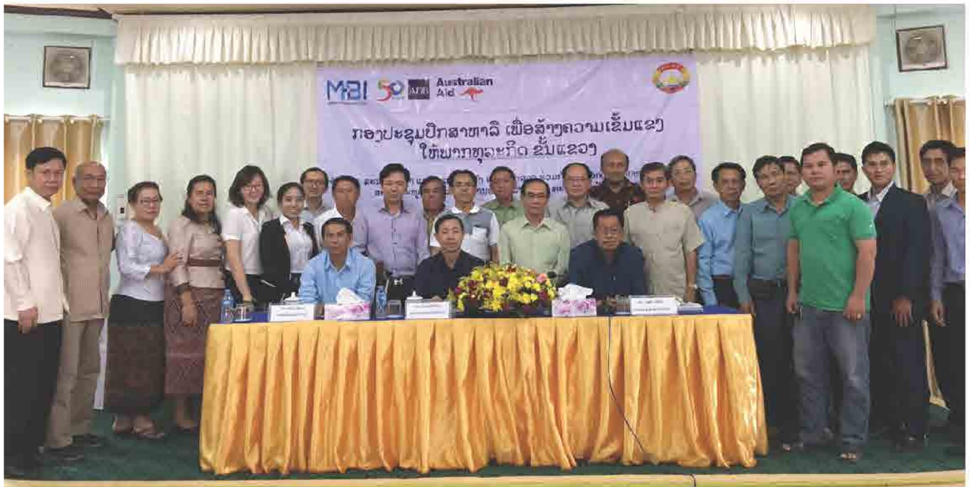
ກອງປະຊຸມ ປຶກສາຫາລື ສ້າງຄວາມເຂັ້ມແຂງ ໃຫ້ພາກທຸລະກິດຂັ້ນແຂວງ ທີ່ ແຂວງ ບໍ່ແກ້ວ ປີ 2017