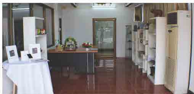
ຫ້ອງວາງສະແດງຜະລິດຕະພັນລາວ ຂອງ ສຄອ ແຫ່ງຊາດລາວ