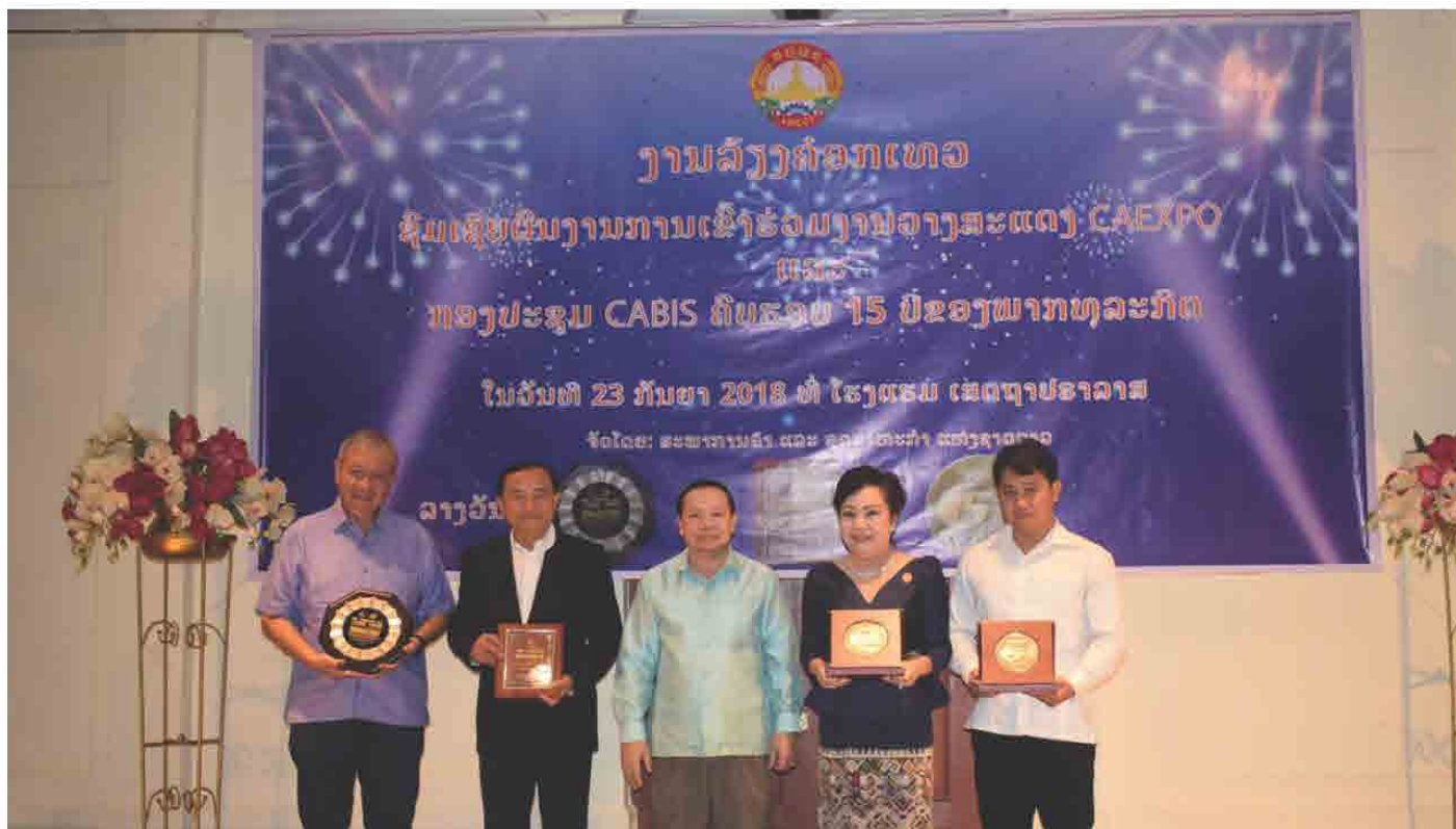
ງານລ້ຽງຄໍອກເທວ ຊົມເຊີຍຜົນງານການເຂົ້າຮ່ວມງານວາງສະແດງ CAEXPO ແລະ ກອງປະຊຸມ CABIS ຄົບຮອບ 15 ປີຂອງພາກທຸລະກິດ ໃນວັນທີ 23 ກັນຍາ 2018 ທີ່ ໂຮງແຮມ ເສດຖາປຣາລາສ