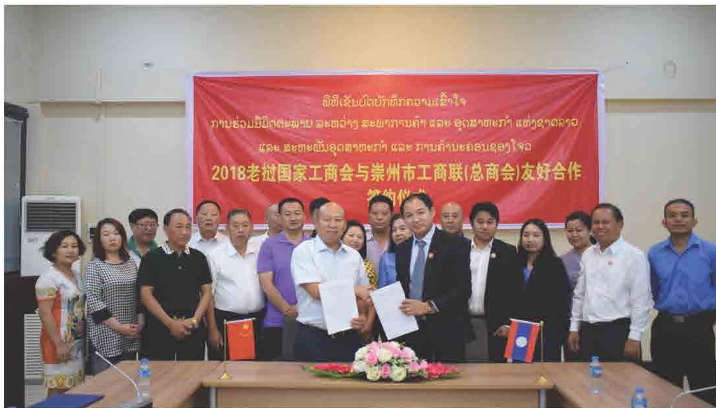
ພິທີເຊັນບົດບັນທຶກຄວາມເຂົ້າໃຈ ການຮ່ວມມືມິດຕະພາບ ສະຫວ່າງ ສຄອຊ ແລະ ສະຫະພັນອຸດສາຫະກຳ ແລະ ການຄ້ານະຄອນຊອງໂຈວ ປີ 2018