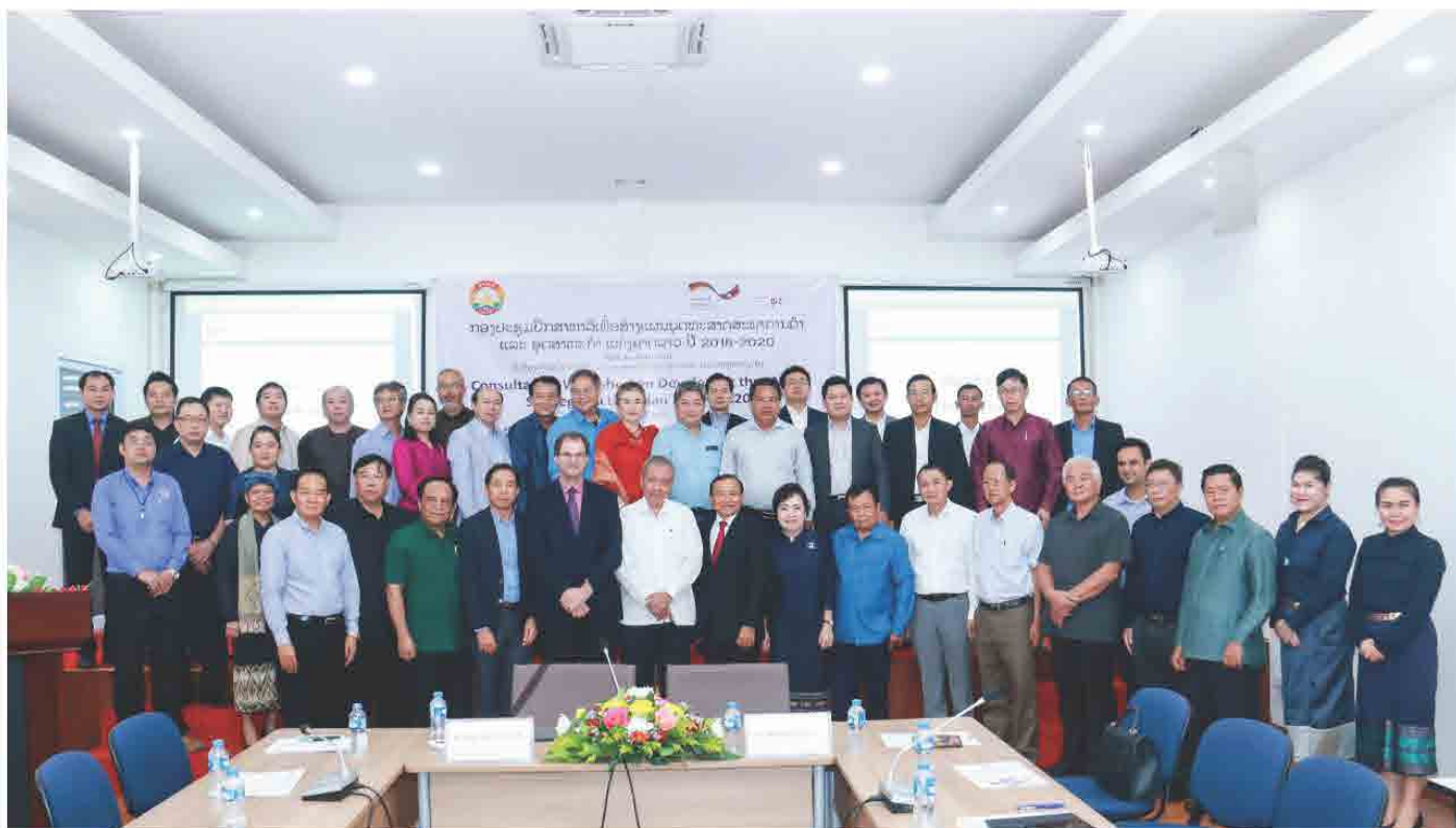
ກອງປະຊຸມ ປຶກສາຫາລືເພື່ອສ້າງແຜນຍຸດທະສາດ ການພັດທະນາ ພາກທຸລະກິດລາວ 2018-2020 ວັນທີ 09 ສິງຫາ 2017 ທີ່ ສຄອຊ