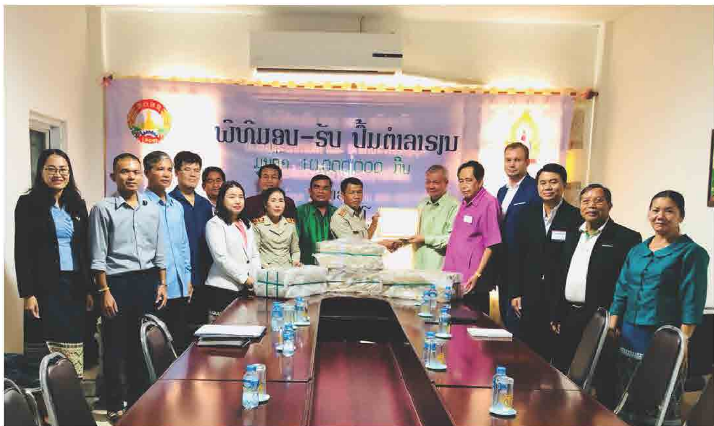
ສະພາການຄ້າ ແລະ ອຸດສາຫະກຳ ແຫ່ງຊາດລາວ ໄດ້ມອບ ປຶ້ມຕຳລາຮຽນ ມູນຄ່າ 10.000.000ກີບ ໃຫ້ກັບ ໂຮງຮຽນ ມ.ຕ ເວີນໄຊ ແຂວງ ຈຳປາສັກ ວັນທີ 11 ມິຖຸນາ 2018 ທີ່ ຫ້ອງການ ສຄອ ຈຳປາສັກ