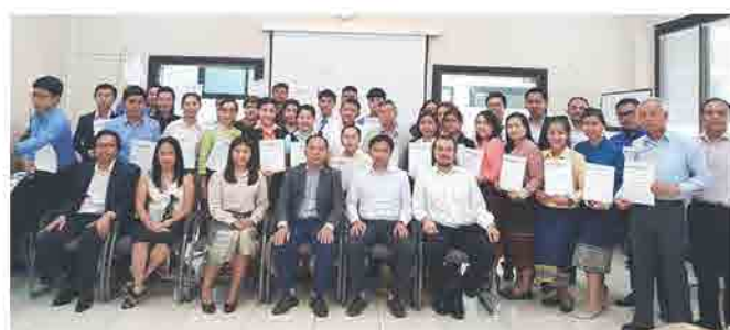
ພິທີເປີດການຈັດຕັ້ງປະຕິບັດ ແຜນງານການສ້າງຄວາມເຂັ້ມແຂງໃຫ້ ວິສາຫະກິດ ຂະໜາດນ້ອຍ ແລະ ກາງ ພາຍໃຕ້ໂຄງການ ການເຂົ້າຫາແຫຼ່ງທຶນ ຂອງວິສາຫະກິດ ຂະໜາດນ້ອຍ ແລະ ກາງ ໃນວັນທີ 14 ກັນຍາ 2018 ທີ່ ສຄອຊ