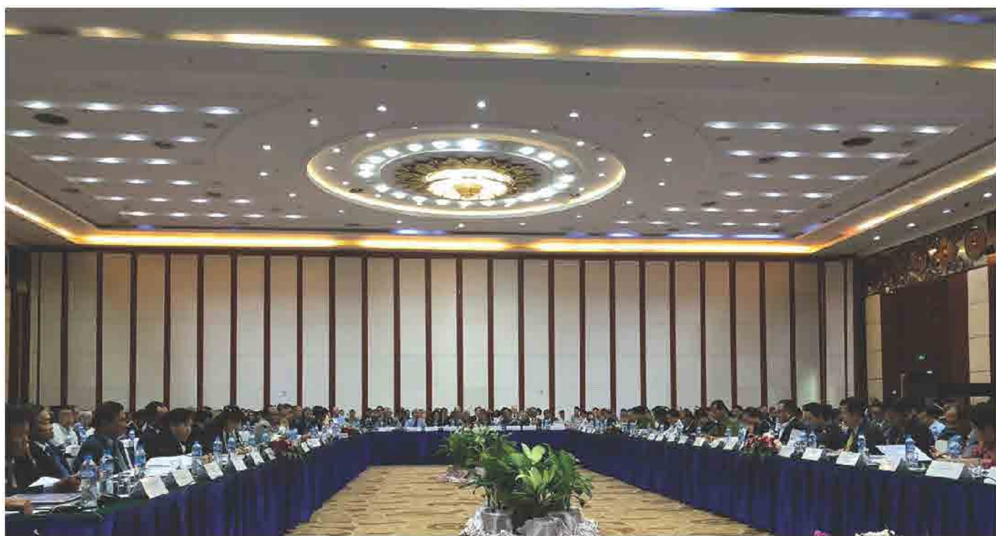
ກອງປະຊຸມທຸລະກິດລາວ ຄັ້ງທີ 11 ວັນທີ 05 ກໍລະກົດ 2018 ທີ່ ໂຮງແຮມ ດອນຈັນພາເລສ, ນະຄອນຫຼວງວຽງຈັນ