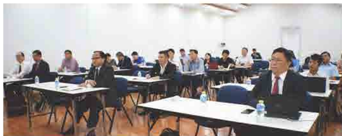
ພິທີເຊັນບົດບັນທຶກຄວາມເຂົ້າໃຈ ກ່ຽວກັບການສະໜັບສະໜູນ ການຝຶກອົບຮົມດ້ານ ໄອຊີທີ ໃຫ້ກັບ ວິສາຫະກິດຂອງລາວ ລະຫວ່າງ ສະພາການຄ້າ ແລະ ອຸດສາຫະກຳ ແຫ່ງຊາດລາວ ແລະ ກະຊວງ ເສດຖະກິດ ຈີນ (ໄຕ້ຫວັນ)