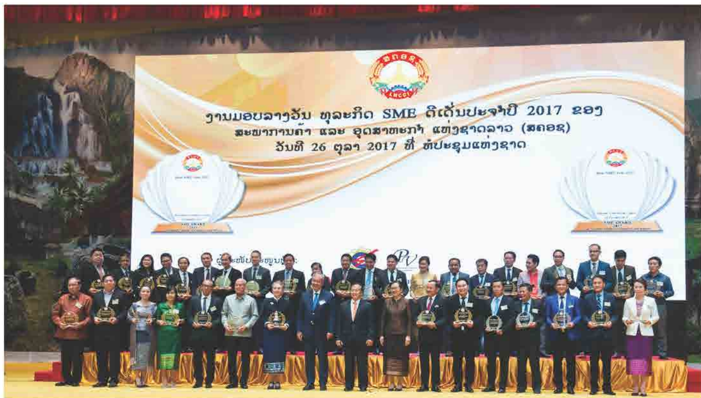
ງານມອບລາງວັນທຸລະກິດ SME ດີເດັ່ນປະຈຳປີ 2017 ຂອງ ສຄອ ແຫ່ງຊາດລາວ ວັນທີ 26 ຕຸລາ 2017 ທີ່ ຫໍປະຊຸມແຫ່ງຊາດ