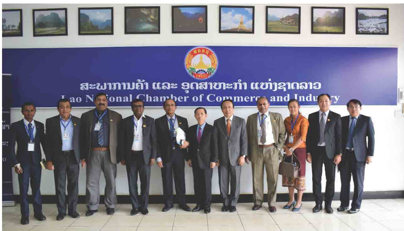
ຕ້ອນຮັບ ຄະນະຜູ້ແທນ ລັດຖະສະພາ ສີລັງກາ ປີ 2018