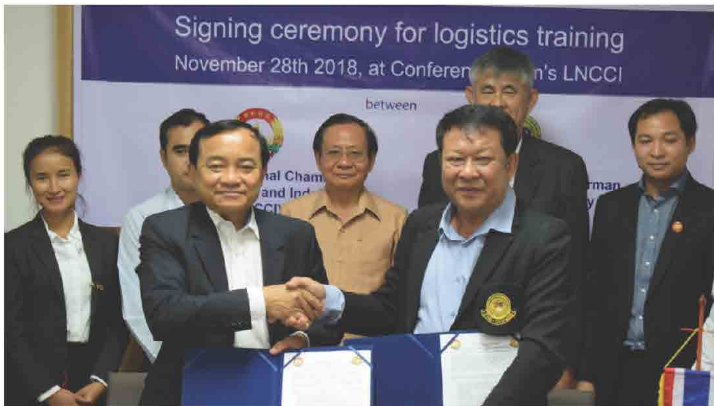
ພິທີເຊັນສັນຍາການຮ່ວມມື ເພື່ອຝຶກອົບຮົມດ້ານໂລຈິດສຕິກ ໃຫ້ຜູ້ປະກອບການລາວ (Signing Ceremony for Logistic Training) ວັນທີ 28 ພະຈິກ 2018 ທີ່ ສຄອຊ