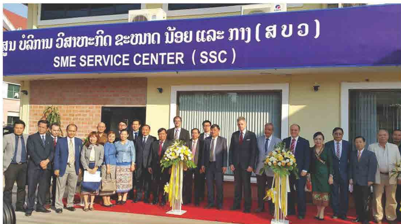
ພິທີເປີດ ສູນບໍລິການວິສາຫະກິດຂະໜາດນ້ອຍ ແລະ ກາງ (ສບວ) ຫຼື SME Service Center (SSC) ໃນວັນທີ 17 ກຸມພາ 2017