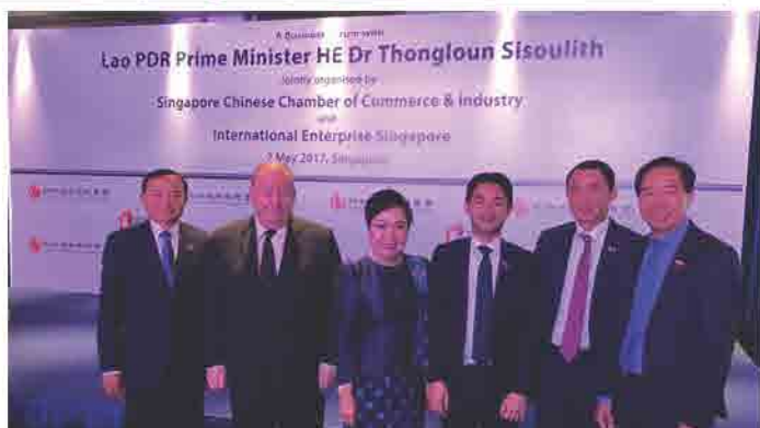
ຄະນະນັກທຸລະກິດ ຕິດຕາມ ຄະນະຜູ້ແທນລາວນຳໂດຍ ທ່ານ ນາຍົກລັດຖະມົນຕີ ແຫ່ງ ສປປ ລາວ ຢ້ຽມຢາມ ປະເທດສິງກະໂປ ໃນວັນທີ 2 ພຶດສະພາ 2017