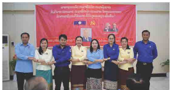
ບັນແຂງຂັນຈັບມື ສ້າງຜົນງານຂອງສາມອົງການຈັດຕັ້ງມະ ຫາຊົນ, ກຳມະບານ, ຊາວໝູ່ ແລະ ແມ່ຍິງ ສຄອຊ