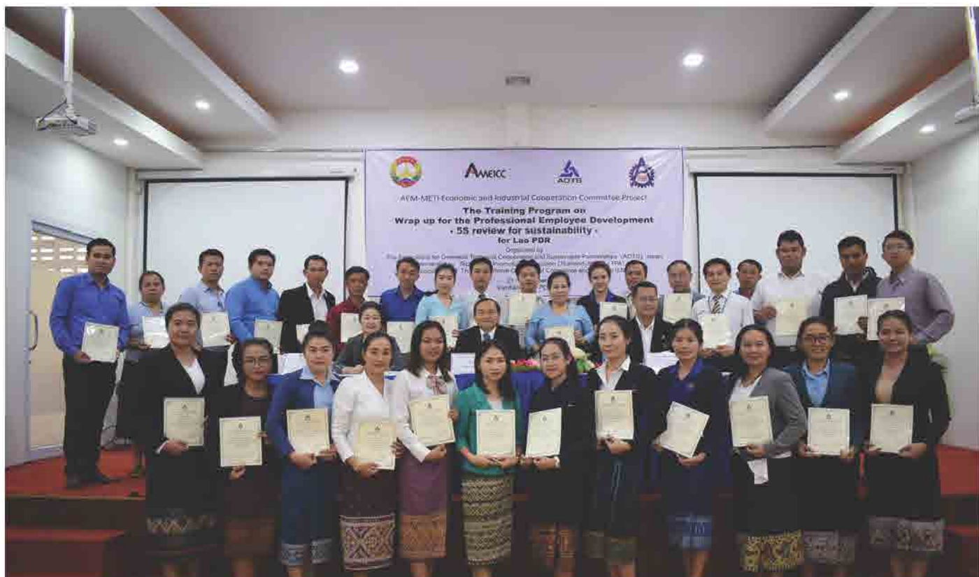
ສຳມະນາ ພັດທະນາບຸກຄະລາກອນຢ່າງມີອາຊີບ (5s) ປີ 2018