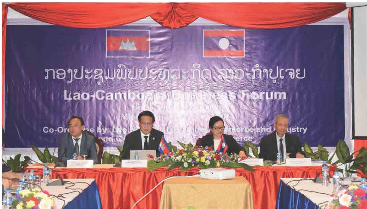
ກອງປະຊຸມ Lao-Cambodia Forum ວັນທີ 04 ທັນວາ 2018 ທີ່ ນະຄອນຫຼວງວຽງຈັນ