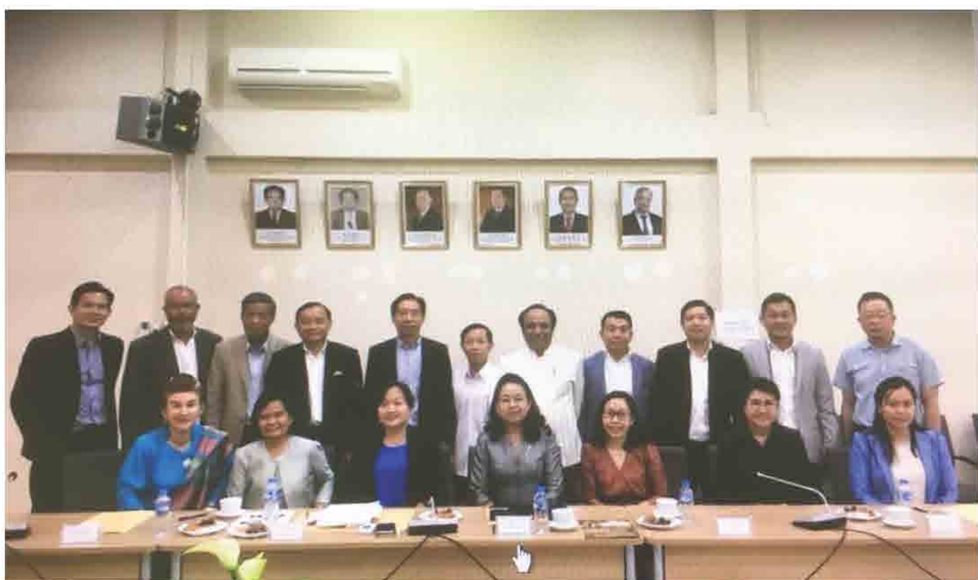
ກອງປະຊຸມ ຄະນະທີ່ປຶກສາ ສະພາການຄ້າ ແລະ ອຸດສາຫະກຳ ແຫ່ງຊາດລາວ ປີ 2018