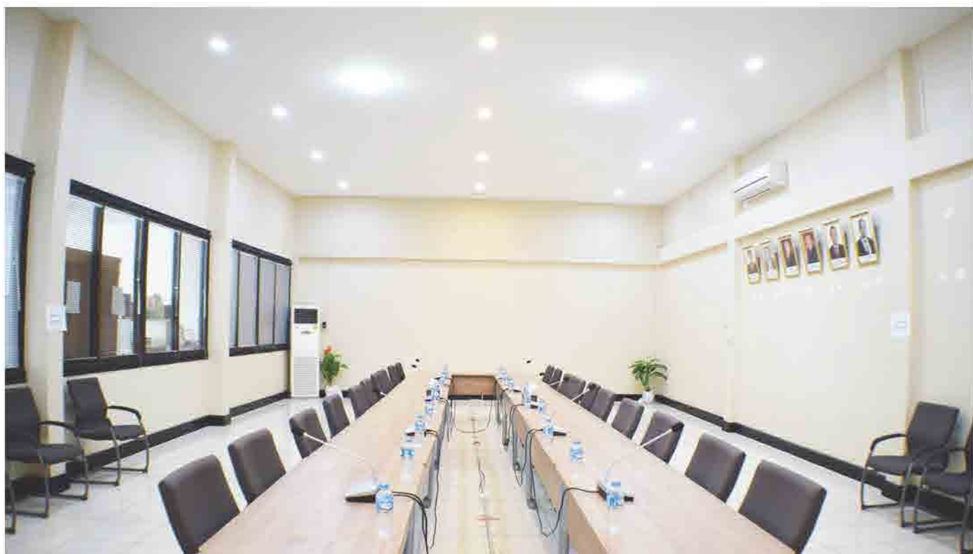
ຫ້ອງກອງປະຊຸມ ກາງ ຂອງ ສຄອ ແຫ່ງຊາດລາວ