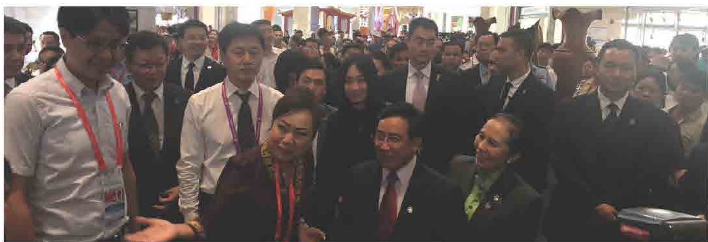
ງານວາງສະແດງອາຊີໃຕ້ South and Southeast Asia EXPO ຢູ່ ນະຄອນຄຸນມິງ, ແຂວງ ຢູນານ, ປະເທດຈີນ ປີ 2017