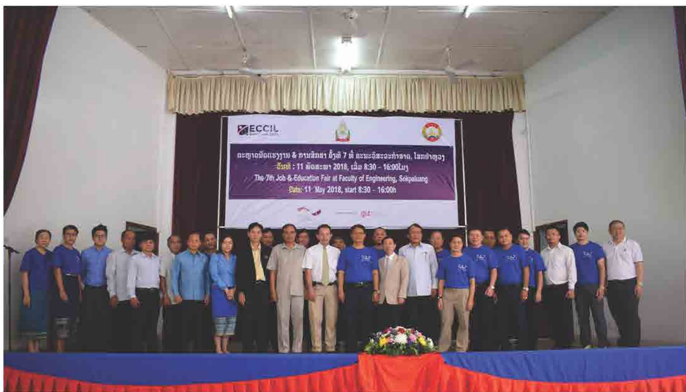
ຕະຫຼາດນັດແຮງງານ ແລະ ການສຶກສາ ຄັ້ງທີ 7 ວັນທີ 11 ພຶດສະພາ 2018 ທີ່ ຄະນະວິສະວະກຳສາດ, ມະຫາວິທະຍາໄລແຫ່ງຊາດ