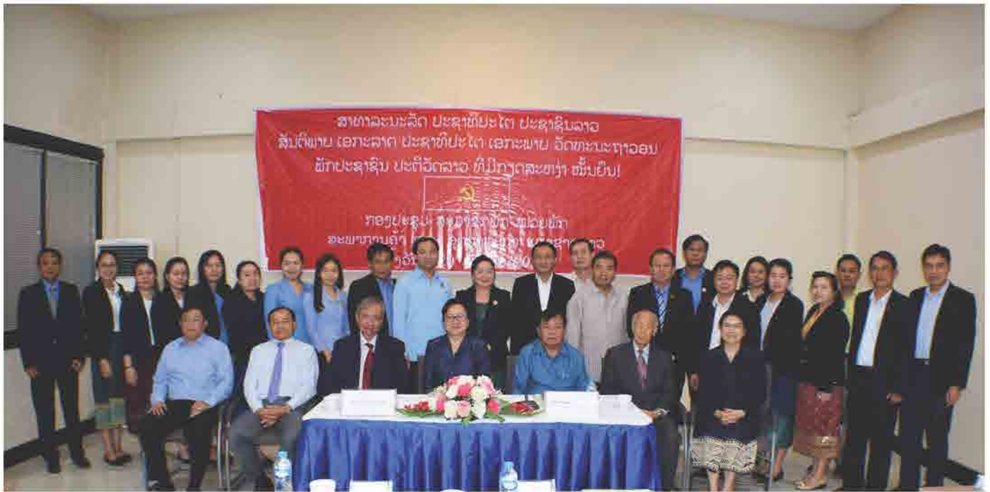
ກອງປະຊຸມພັກ ໜ່ວຍພັກ ສຄອຊ ຄັ້ງວັນທີ 29 ມັງກອນ 2018 ທີ່ ສຄອຊ