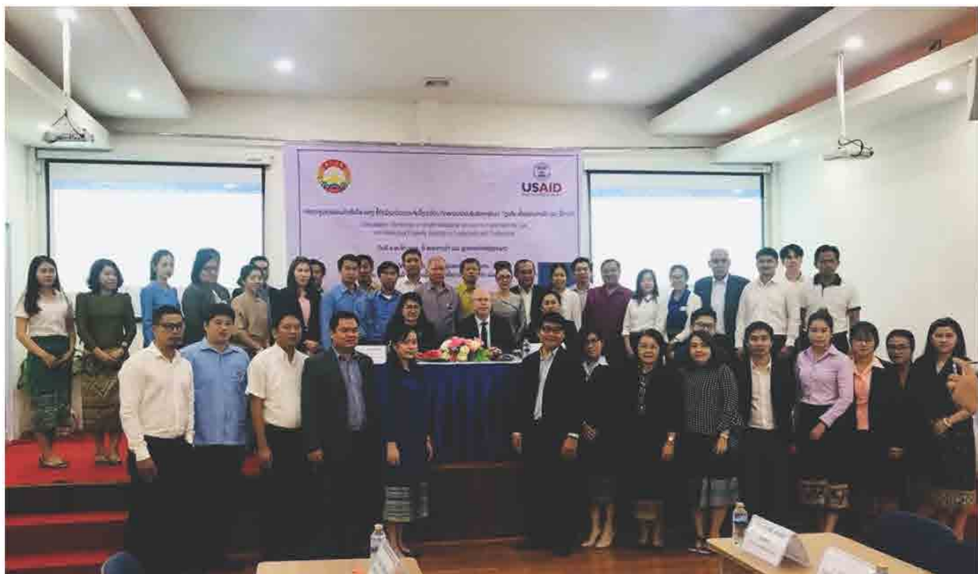
ກອງປະຊຸມທາບທາມຄຳເຫັນໃສ່ ຮ່າງຂໍ້ຕົກລົງວ່າດ້ວຍການຈັດຕັ້ງປະຕິບັດ ກົດໝາຍວ່າດ້ວຍຊັບສິນທາງປັນຍາ ກ່ຽວກັບ ເຄື່ອງໝາຍການຄ້າ ແລະ ຊື່ການຄ້າ ປີ 2018