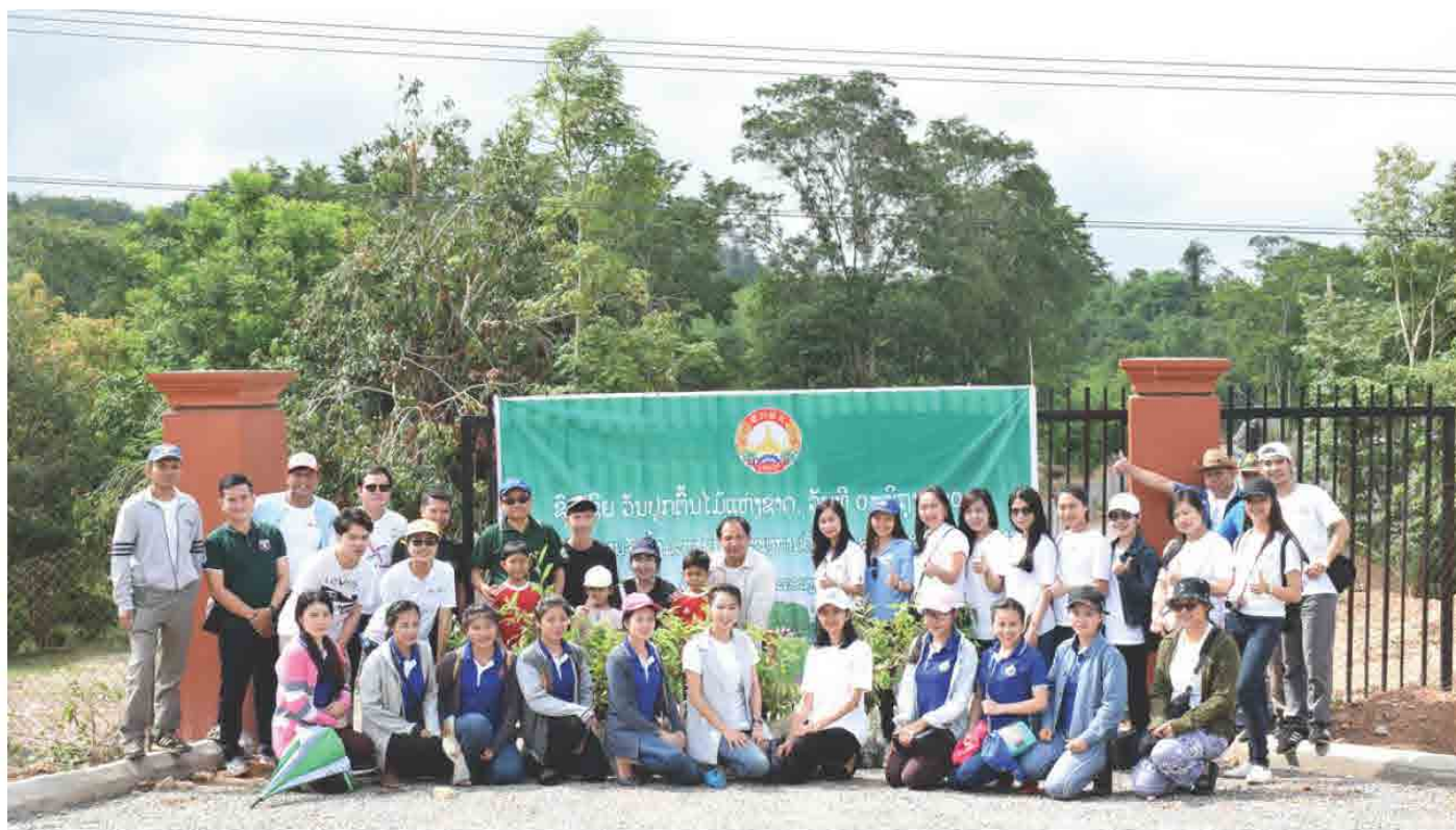
ພະນັກງານ ສະພາການຄ້າ ແລະ ອຸດສາຫະກຳ ແຫ່ງຊາດລາວ ຮ່ວມແຮງຮ່ວມໃຈກັນປູກຕົ້ນໄມ້ໃຫ້ເປັນປ່າ ໃນວັນທີ 01 ມິຖຸນາ 2018 ທີ່ ເມືອງ ສັງທອງ