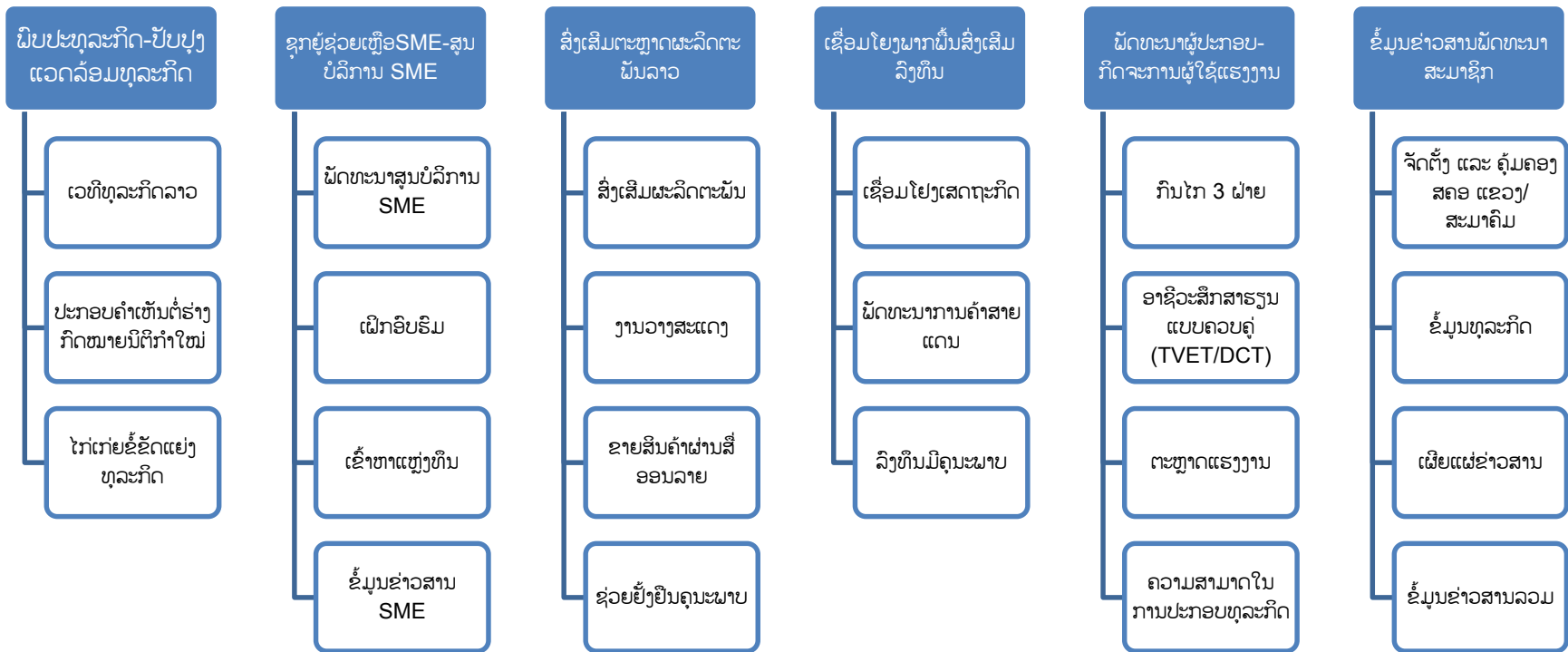
ຮູບພາບທີ1: 6ເສົາຄໍ້າຍຸດທະສາດແຜນການພັດທະນາຂອງ ສຄອຊ ໃນປີ 2021-2025